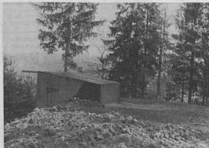
Podvig prebivalcev Goropek podpira tudi KS