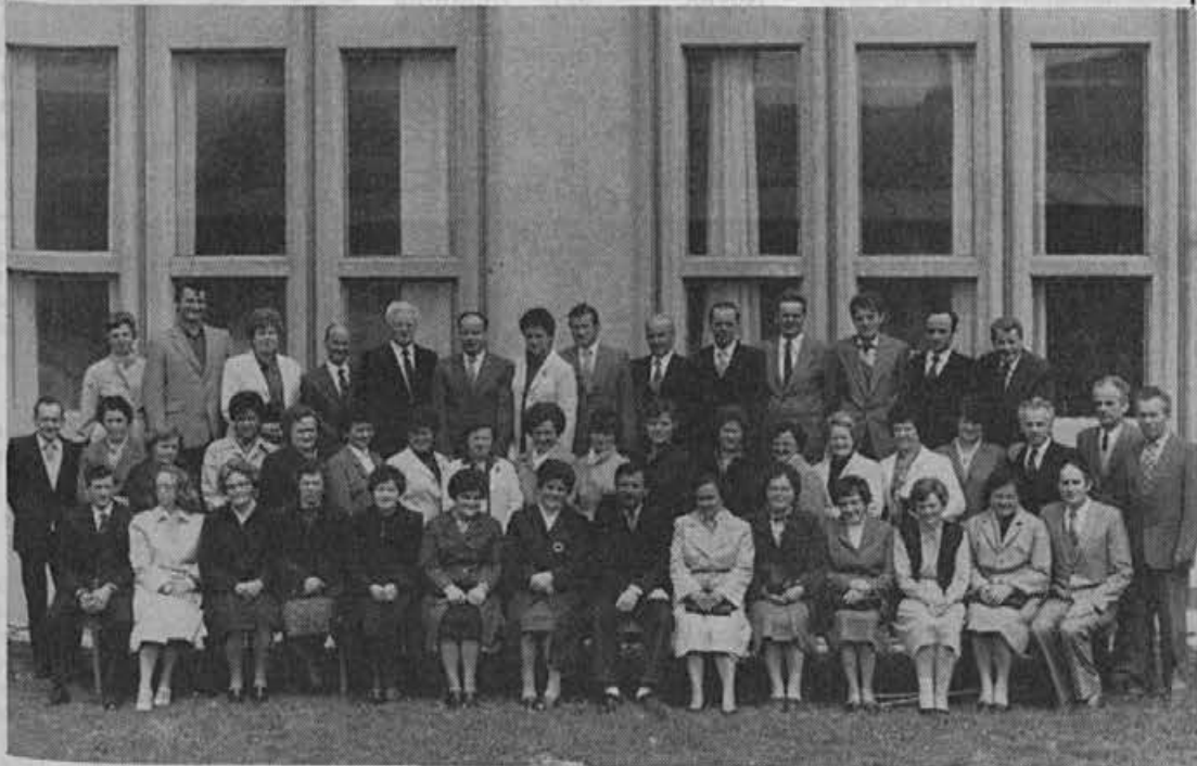
Delavci s 30 let skupne delovne dobe