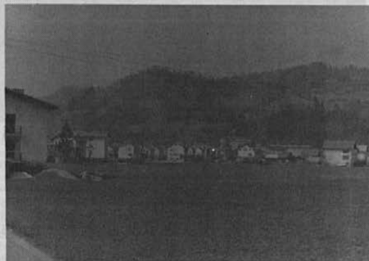
Lep prostor za novo stanovanjsko sosesko, kajne?