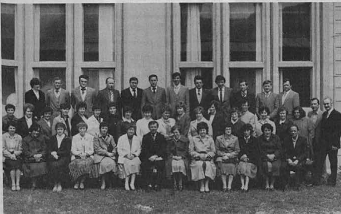
Delavci ki letos dosegajo skupaj 20 let delovne dobe