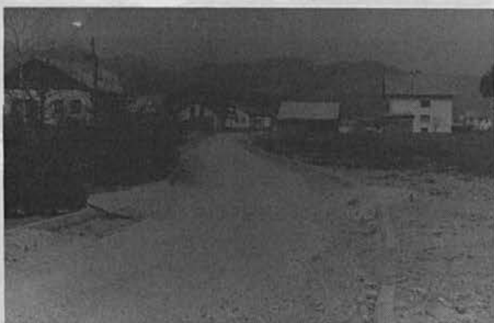
Ali bo cesta Jurišnega bataljona res še dolgo tako neurejena

Pripravljen je zazidalni načrt soseske S-7, ki naj bi jo gradili od Freliha proti Blažontarju. Kar zadeva preostalo gradnjo, je še vedno problem precej parcel v dosedanjem zazidalnem okolišju, ki jih lastniki nočejo prodati. Občina ali krajevna skupnost nimata denarja, da