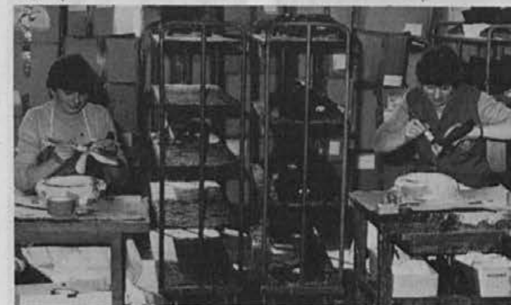
Dragica Peternelj in Cilka Mlinar pri gumiranju

Vili Mlinar , vlivalec na DESMI: trenutno nimamo kakšnih večjih problemov, tudi material kar redno prihaja in nam omogoča, da izpolnjujemo plan in normo. S svojo deseto skupino zaslužim okoli 22.000.— din mesečno in sem kar zadovoljen. Tu in tam nam tudi kaj po-