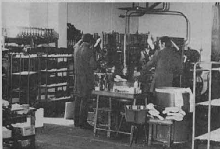
Kdaj združitve obih delov montaže brizgane obutve?

Delavci ene izmed izmen pa so svoje delo ocenili takole: