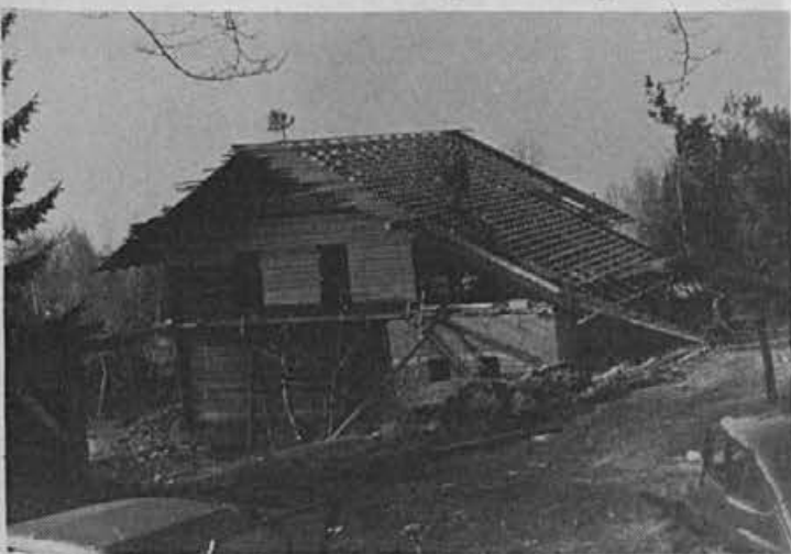
Dom Prešernove brigade na Žirovskem vrhu, ki je že dolgo pod streho, naprej pa ne gre

Vsa povojna leta je bila na Žirovskem mladina določene vasi aktivnejša in naprednejša od drugih. Najprej so izstopali mladinci v Račevi, sledili so jim mladinci v Brekovicah, ki smo jim že v šali rekli, da so postale zaradi njih Brekoviče slavne. Tudi na Breznici so bili mladinci pred kakimi šestimi leti zelo delovni, tudi Selani niso držali križem rok. Pred leti se je v dobri organiziranosti ujela tudi mladina iz Žirovskega vrha.