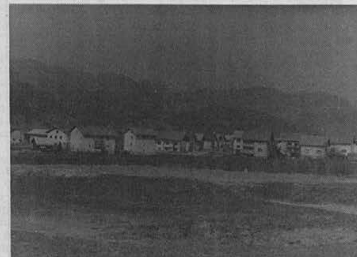
Takole izgleda nekdanje smetišče; kako neki bi lahko izgledalo še lepše?