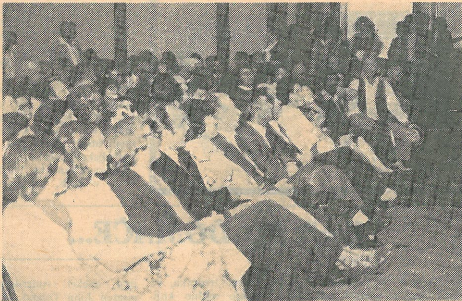
Generalni Konzul SFRJ, sa članovima Konzulata i predstavnicima jugoslovenskih privrednih organizacija u Sidneju na koncertu Pesme leta.