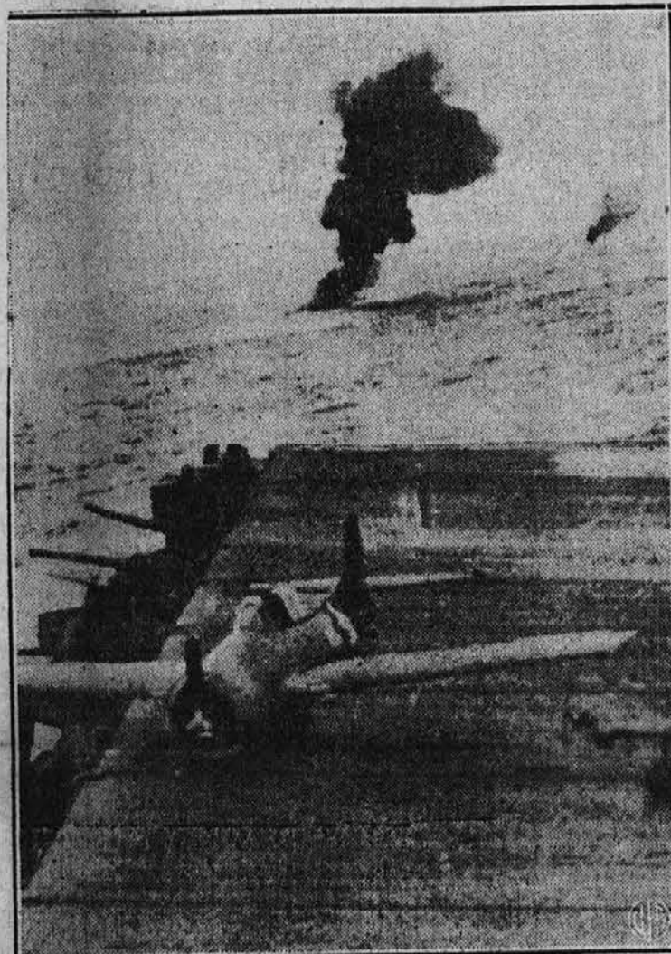
Gornja slika nam kaže ameriško letalo, ki je srečno ušlo japonskim napadalcem in pristalo na ameriškem nosilcu letal v Južnem Pacifiku. V ozadju slike pa je videti oblake dima gorečih letal, ki so padla v morje.