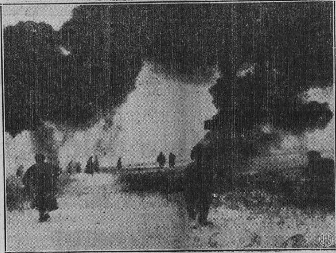
Ruski bojovniki neprestano napredujejo o na vseh frontah. Slika nam kaže ruske čete s strojnimi puškami, ki pod kritjem topniškega ognja zavzemajo nove pozicije na pohodu proti Rostovu.

BE 100% WITH YOUR BUY WAR BONDS DELO DOBIJO Dobro službo dobi Sprejme se natakarcica, najraje Slovenka, za 5 ali 7 večerov v tednu. Za podrobnosti pokličite Yanković Cafe, 528 E. 152. St. Liberty 9387. (x) Delo dobi mesar Izučen mesar dobi dobro in stalno delo v slovenski mesnici. Za naslov vprašajte v uradu tega lista. (x) MALI OGLASI Stanovanje in lokal Odda se trgovski lokal in 6 sob, ali pa samo sobe na 1293 E. 55. St., vogal. Zglsajte se pri lastniku zajej. (11) Lepa prilika Naprodaj je popravljalnica čevljev z vsem orodjem in stroji. Na teden dela $100 prometa in več. Zglsajte se na 14610 St. Clair Ave., ali pokličite IVanhoe 3045. Jako lepa prilika za podjetnega človeka (x) V Collinwoodu! Naprodaj je apartment za 4 družine, 20 sob, 4 kopalnice obita s ploščami, 4 furnezi, blizu Lake Shore Blvd. Nekaj malega gotovine takoj. Cena je $12,900 Hiša za 3 družine, 2 trgovska lokala, 2 garaži, lot 80x130. Se mora prodati. Cena je $4,600. J. Knific Realty 18603 St. Clair Ave. IV 7540; svečer KE 0288 (Jan. 13, 15) Tri sobe v najem V najem se oddajo 3 čedne sobe, pripravne za novoporočenca. Vse udobnosti na razpolago. Naslov dobite v uradu tega lista. (12) Stanovanje ižejo Iščete 4 sobe za 3 odrasle osebe brez otrok. Najraje v Collinwoodu ali v Nottinghamu. Kdor ima kaj primernega, naj pokliče IVanhoe 3929. (12)