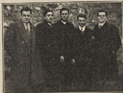
Dekanijsko vodstvo FKA Slov. Bistrica.