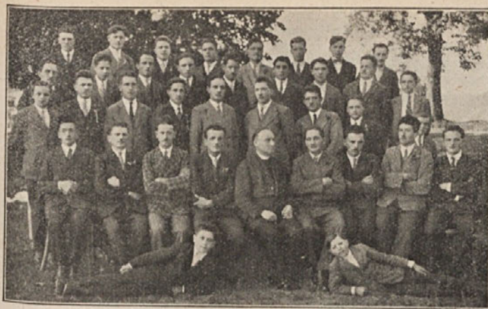
FKA Šmihel nad Mozirjem.

vilka, da pri tej pač nikakor ne smemo ostati! Vsaj petkrat toliko nas mora biti še letos! Zato: gornjesavinjski fantje in dekleta, na agitacijo za »Naš dom«! Manjka nam tudi organizacije. Edino šmihelčani imajo organizirano delovno skupino FKA. Ti so po navodilih lanskega dekanijskega tečaja šli takoj na delo ter zaslužijo ti vrli hribovski fantje pohvalo za svojo vnemo. Posnemajmo jih! — Franc.