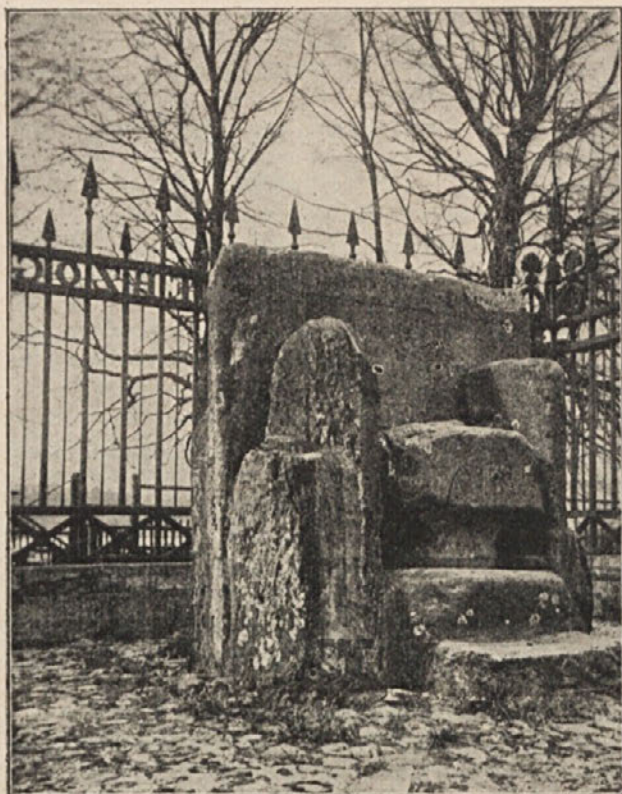
Vojvodski prestol na Gosposvetskem polju pri Celovcu.

Na Koroškem so, na Primorskem in na Goriškem. Zemlja je še njihova, materina beseda deloma. Pesem zamira, z njo veselje. Naše podpore potrebujejo, naše ljubezni, našega glasu. Ne pozabimo jih, ki jim je mati pela isto pesem in govorila v enakih besedah kakor nam.