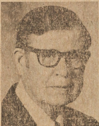
IN LOVING MEMORY OF THE FIRST ANNIVERSARY OF THE DEATH OF MY HUSBAND AND OUR BROTHER