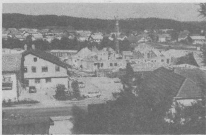
Pogled na gradbišče »Dvori«, kjer nastaja nova soseska