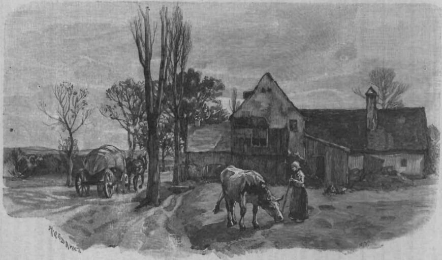
Ob veliki cesti.