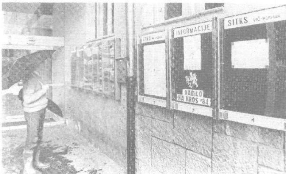
V tej vitrini, postavila jo je občinska ZTKO ob vhodu v kino Vič, bodo rekreativci in ljubitelji športa odslej lahko redno prebirali obvestila o rekreativnih aktivnostih in rezultatih.