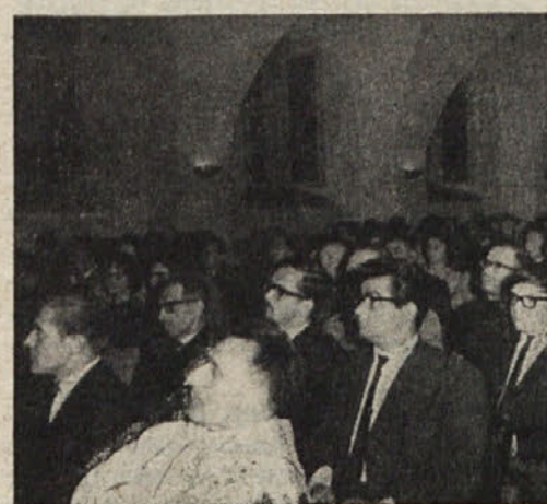
Dunajski Slovenci in Hrvati na proslavi

v gozdu — to je način, kako si večina naših rojakov okoli Port Arturja v Kanadi služi svoj kruh. Vsak teden gredo s podjetjem po 25, pa tudi po 100 kilometrov daleč v gozdove, za nedeljo pa se vrnejo k svoji družini. So pa drugi, ki ostanejo zdoma po cel mesec ali še več. Gotovo to ni majhna žrtev zanj in za njihove družine. Dolej so delali akordno delo in v devetih mesecih precej zaslužili. Seveda so se gnali in napenjali svoje moči do skrajnosti. Tako so nekateri prislužili pri takem sezonskem delu po 4000 dolarjev. Sedaj pa napovedujejo, da bodo podjetja uvedla razne stroje za prenašanje in skladanje lesa. Delavce že sedaj silijo na delo za dnevno plačo.