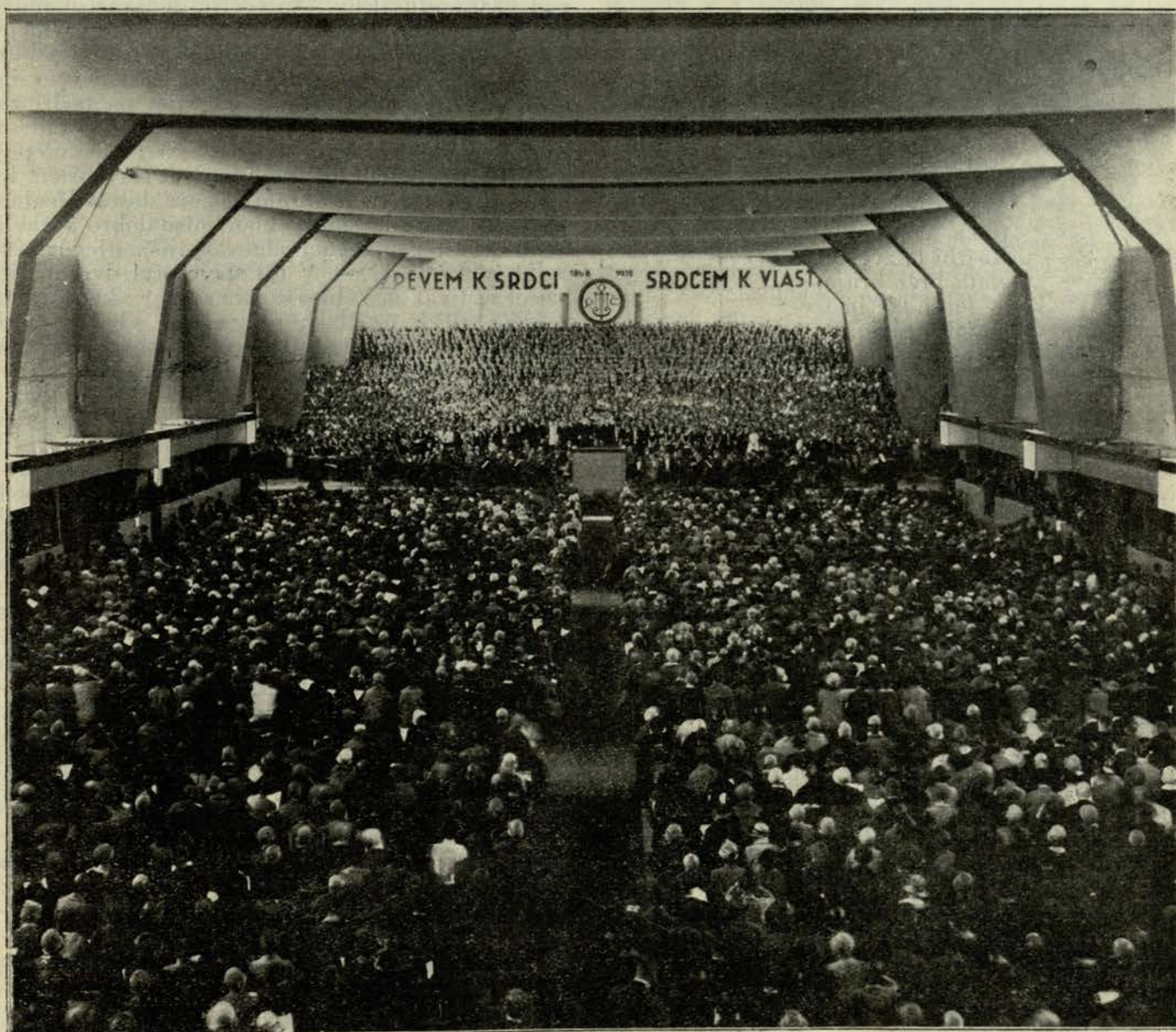
(Na odru 5000 pevcev in pevk ter 120 godbenikov.)