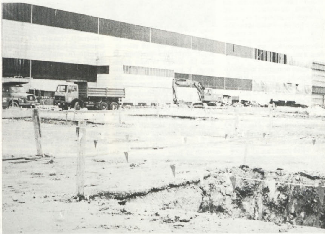
Barak ni več. Na mestu, kjer so nekoč stale barake, so stekla zemeljska dela: izkop temeljev za lahko presemico.

tu pripelje na tovarniško področje do objektov tovorne prikolic in tovorne avtomobilov. Z izgradnjo industrijskega tira in industrijske železniške postaje bo odpadel največji del tovarnega transporta po cestah tako na dovozu surovin kot na odvozu gotovih izdelkov.