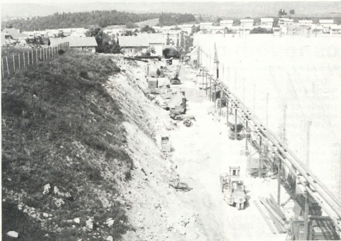
Rekonstrukcija lakimnice je pomembna investicija v TA, vredna po predračunu 48 milijard starih din Ureja pa se tudi dovoz do lakimnice in v teku je gradnja aneksa ob lakimnici.

Tir se odcepi od proge Ljubljana - Karlovac v bližini pokopališča v Šmihelu in se po viaduku