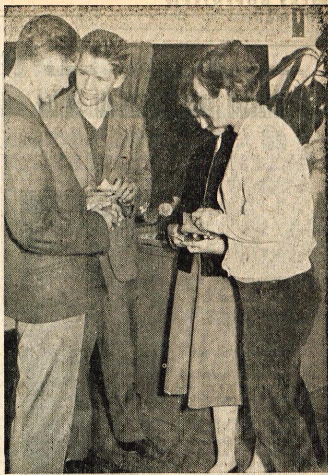
Te dni — v glavnem v soboto, 10. oktobra — so po šolah, delovnih kolektivih in drugih organizacijah LMS sprejeli v mladinske vrste nekaj tisoč novih članov. Ta dogodek so mladi člani počastili z raznimi prireditvami in akademijami. Na osemletni šoli Lucijana Seljaka v Stražišču pri Kranju so svečano izročili nad 100 mladinskih izkaznic novim članom, ki so obljubili, da bodo častno zastopali cilje naše mladine v socialistični družbi.