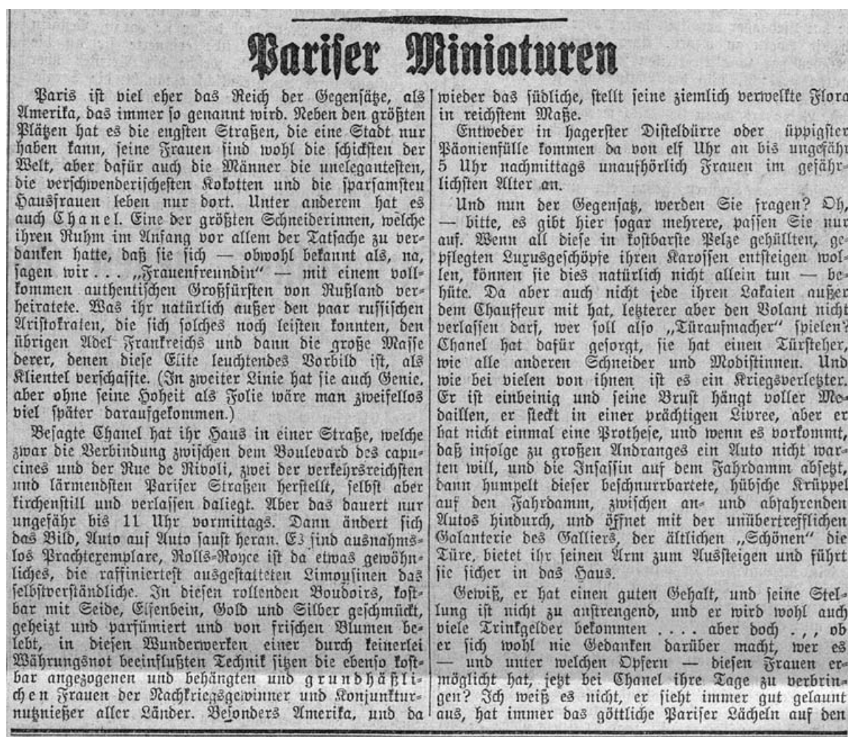
Pariser Miniaturen. Freiheit , 19. 11. 1928, št. 397, str. 6.

(Österreichische Nationalbibliothek: http://anno.onb.ac.at , citirano 5. 2. 2021)