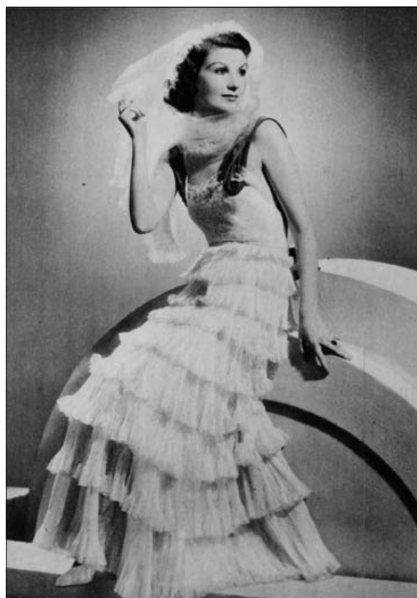
Ljubka obleka iz čipk, z volančki iz tila. Naramnice iz zelenega žameta. Chanelin model.

V dunajskem časopisju je spor odmeval še januarja 1930 v časopisu Der Tag . 63 Poleg že znanih dejstev so bralci izvedeli še konkretne podatke o tožbi. Molnár naj bi plačal malenkostnih 20.000 pengov 64 : »Najmanj toliko zahteva francosko pod-