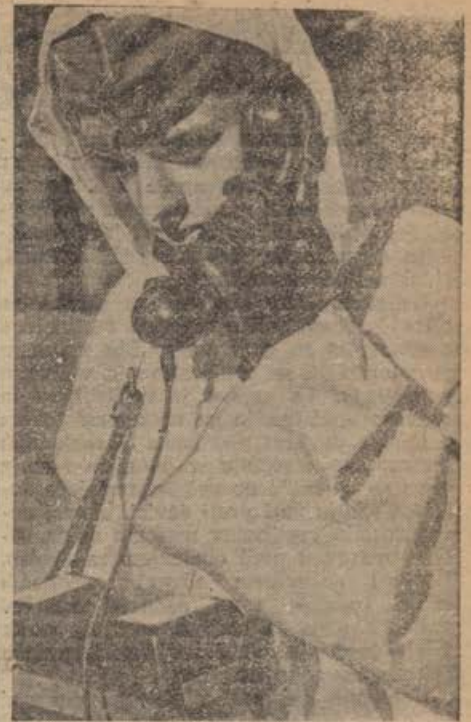
Störungssucher bei der Arbeit. ...und dann wird die Fernsprechvermittlung angerufen und die Leitung in Ordnung befunden

Tudi v Cilli-ju, Windischfeistritz-u in Rann-u so dan oborožene sile proslavili meščani na podoben način skupno z vojaštvom kakor v Marburg-u.