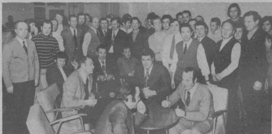
Člani sindikalne podružnice Slovenija ceste iz Kavčičeve v Mostah so množično darovali kri

V mehaničnih obratih je zaposlenih 226 delavcev. Dne 26. januarja 1973 se je udeležilo krvodajalske akcije 60 tovarišev, kar predstavlja 27 %; dodatno k temu pa se je udeležilo oddaje krvi še 54 tovarišev iz SIP in 22 tovarišev iz AP, skupaj torej 38 % članov vsega kolektiva.