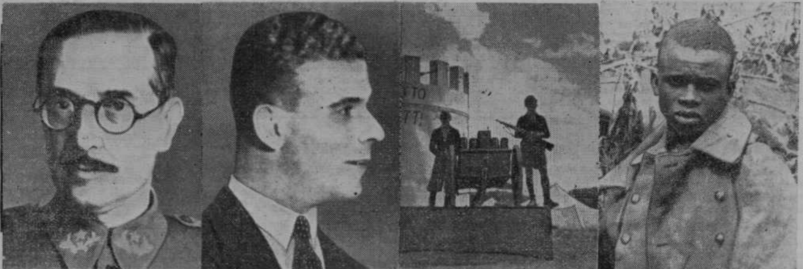
Jo. Beigbeder, zunanji minister Španije

Nova francoska vlada. Francoska vlada je radi resnosti položaja na bojišču zadnje nedelje ves dan in vso noč zasedala ter pretresala položaj z vojaškega in diplomatskega stališča. Posledica tega dolgega posvetovanja pod predsedstvom predsednika republike Lebruna je bil odstop sedanje vlade pod pred-