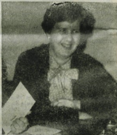
Srečni dobitnik najvišje oktobrske nagrade Komunalne banke in hranilnice Kamnik.

V mesecu oktobru so se v počastitev svetovnega dneva varčevanja zvišale hranilne vloge za 11.000.000 dinarjev. Banka je izdala 120 novih hranilnih knjižic. Zreba je dodelil nagrado v znesku 30.000 dinarjev vlagatelju hranilne knjižice št. 2039, v znesku 20.000 dinarjev vlagatelju hranilne knjižice št. 3236 in v znesku 10.000 dinarjev vlagatelju hranilne knjižice št. 1540.