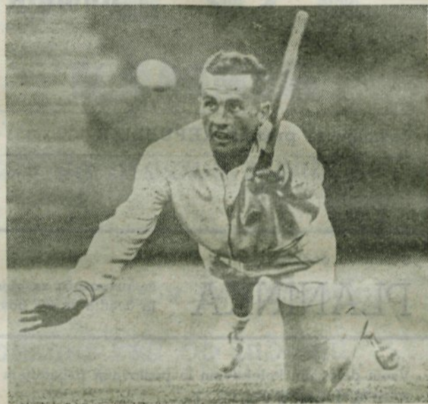
Tako akra-tiven tenis igrajo samo Avstraleci

iela velik krog mladine, ki prej razen šolske telesne vzgoje ni imela priložnosti za izživljanje v telesni kulturi, vendar pa bi se ta morala omejiti na določene športne panoge (rokomet, košarka. Zakaj npr. gojiti v teh družtvih odbojko, medtem ko ima odbojcarska sekcija tedensko redne treninge za pionirje in