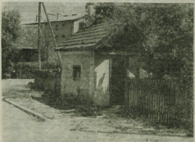
Pokvarjena cestna tehtnica v Kamniku, ki ni več vredna popravila. To ni samo v škodo lepi podobi in urejenosti našega mesta, ampak povzroča precejšnje negotovanje pri tistih, ki bi potrebovali dobro javno tehtnico pri svojem delu.

Občinska komisija za vpis posojila za obnovo Skopja