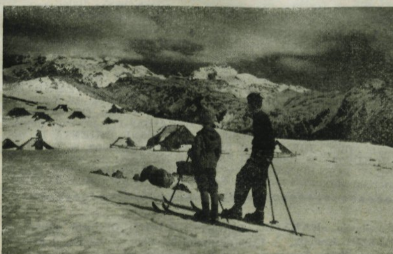
Smučarska vlečnica bo še bolj pritegnila smučarje na čudovita snežišča Velike planine