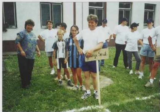
Ekipe v vrsti. Včasim začnemo!

V soboto smo se že v dvej vöri dobili, naj vse pri cajti mam pripravleno. Joživa Gyečeka biciklin je tak vögledo kak okinčan krispan. Privlejško je kromple, kanglo, vauže..., ne vejam, ka so si mislili njagvi doma. Vsakšo ves so čakale