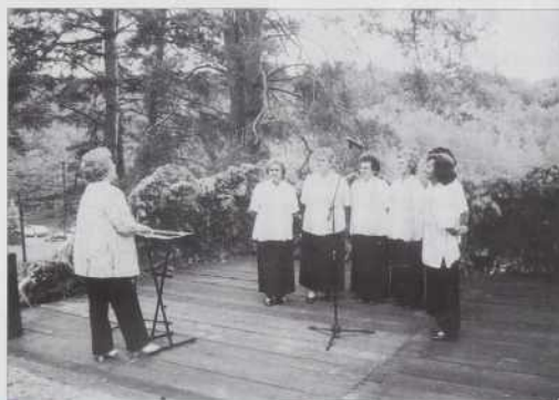
Števanovske ljudske pevke.

Ob našem vaškem dnevu vsakega, ki se je udeležil našega programa, lepo pozdravljam. Na podlagi odločbe sveta samouprave, da nes že četrtič organiziramo