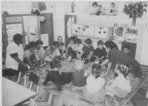
Malčki na Seniku z vzgojiteljico iz Murske Sobotice.

Predavatelj je udeležencam delavnice prikazal preproste in zanimive postopke izdelave različnih izdelkov iz papirja, granulata (umetna plastična snov v raznobarnih zrcnih, ki se, ogreta na 270 stopinj, da oblikovati v različne okrasne