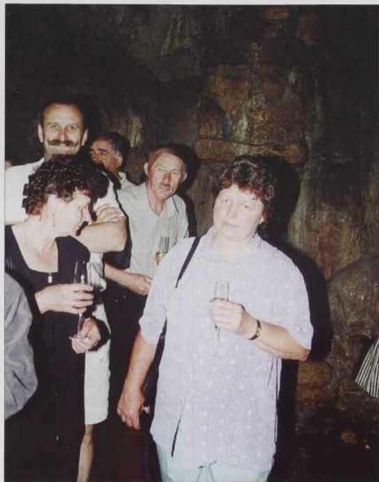
Tū se je Kruc že tō smejau.

brezi palinke tak drveno mo ojdli cejli den kak mački.“ Gda smo pri Lipi stanili, Kruc iz Sombotela si je že bajüsi slato.