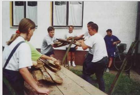
Dolenji Senik z deskami.

Rano spirtolejt so mi že gospaud varaški dekan na znanje dali, ka v Varaši gli tau nedelo majo fermo, potrdjavanje. Dobro, eno leto vönjamo s programa sveto mešo, vej pa tau je vejn döjn nej taši veltji grej. V kulturnom pro-