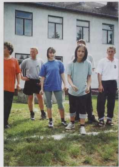
Sakalovske deklina s krumpiči.

Steri organiziramo prireditve, dobro vejmo, kaše briga je tau, če bau zavole lüstva za publiko ali nej. Tau je štja skur bola važno, kak tau, kak se posreči program. Zatok smo pa posaba pozvali vse porabske kulturne skupine,