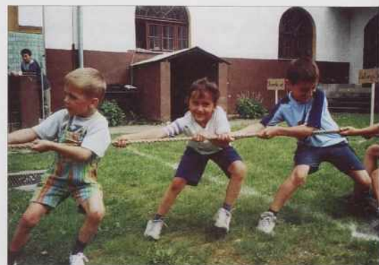
Vlejči, mala, vlejči!

napunila, dapa bilau nas je kaulek 80 gledalcev, gda so madrigalisti gorstaupili.