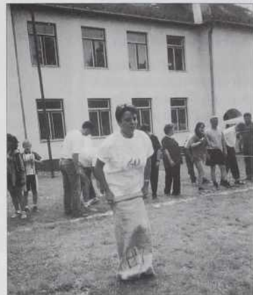
Vejte, ka je v žakli skakati ranč nej leko delo?