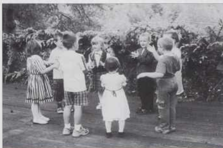
Mali mlajši iz domanjoga vrtca.

nekaj ur pozabi svoje vsakodnevne skrbi, skupaj se naj veselijo mladi in starejši, tukaj živeči in bivši prebivalci ter gostje, ki so s svojo prisotnostjo počastili našo prireditiv..." Za(h)valila se je vsakšomi, sto je na kakšenkoi način, formo kaj pomogo pri tejm, naj se posreči vaški svetek v Števanovci, posaba se je za(h)valila vsejm ženam,