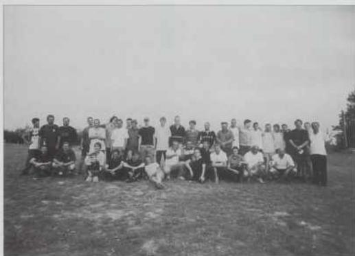
Vse štiri ekipe vkūper.