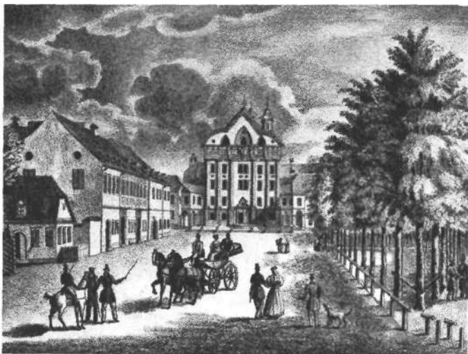
Kongresni trg okoli l. 1850.

V začetku 30tih let vidimo sploh pri nas na jugu v vseh treh naših današnjih prestolnicah nenavaden porast narodnega meščanstva, močne začetke narodne kulture in prodiranje prepovednih idej v višje meščanske kroge. (Začetki nar. časopisja, potreba