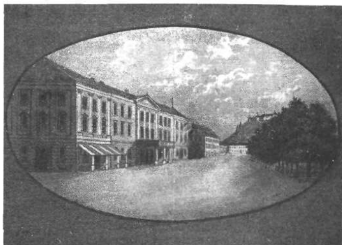
Kazina okoli l. 1850.

Da bo poslopje popolnoma odgovarjalo svojemu namenu, da bo solidno in okusno zgrajeno in da bodo prostori primerno urejeni, bo društvo pozvalo več tukajšnjih in zunanjih arhitektov, da napravijo z ozirom na stavbišče, velikost in potrebe društva načrte in jih pošljejo s proračuni odboru, ki si bo med njimi izbral najboljšega. Sprejeti načrt bo primerno nagrajen, drugi se bodo na zahtevo vrnili.