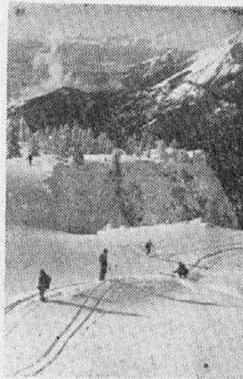
Sneg na Krvavcu

Med najbolj znane pomorske podjetnike našega časa spadata dva Grka, Sokrates Onassis in Spiros Niarhos, ki delujeta v Ameriki. Med njima se je vnela tekma, kdo bo zgradil največji parnik na svetu. Zmagal bo bržkone Niarhos, ker je naročil v ladjedelnih Massachusettsu ladjo, ki bo imela 106 tisoč ton. Orjak bo tako ogromen, da ne bo mogel pluti skozi Sueški prekop. Prevažal bo nafto okoli Afrike, a stroški bodo kljub temu manjši, ker prevozniki