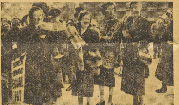
Delegacija žena, poslancev angleškega Spodnjega doma, ki so jo vodile voditeljice laburistične stranke, je predložila parlamentu spomenico, v kateri 80.000 angleških žena zahteva, da bi načelo »za enako delo enako plačilo« veljalo tudi za ženske

Ko so v Guatemali vladale razne reakcionarne klike, ki so jih podpi-