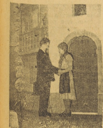
»Cvetje v jeseni«, prizor iz III. slike, ko pride Kosmov Janez (Grad Milana) na obisk k Presečnikovicim in se pozdravi z Meto (Tekavec Ida)

Po ustanovitvi društva »Svoboda« se je prosvetno življenje v Dolu pri Ljubljani zelo poživilo