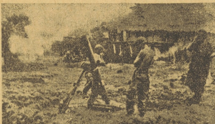
Iz bitke okrog Dien Bien Fuja