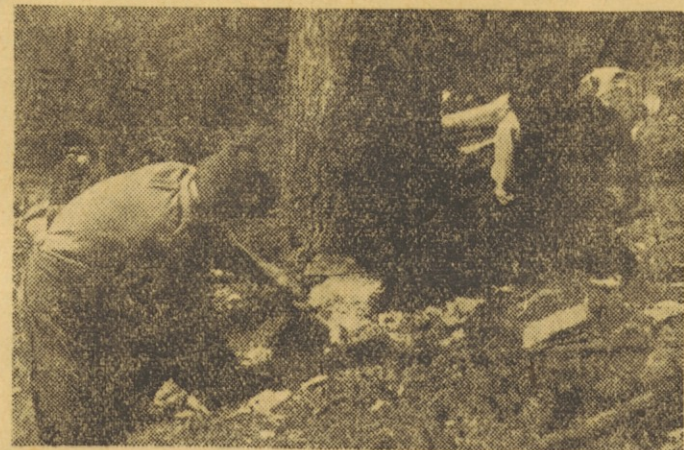
Letošnji družbeni plan je znatno omejil sečnjo lesa, ker ga posekamo poč, kot je prirasla. Skladno s tem se bo tudi žagarska industrija skrčila. Les kaže še bolj predelovati v končne proizvode. To pa bomo dosegli s smotno organizacijo lesnopredelovalne industrije in z združevanjem teh podjetij

di upravno režijo, saj ima sedaj vsako podjetje svojega knjigovodjo, blagajnika, komercialista itd. Mogoče torej ne bi bilo napačno, če bi mestni zbor proizvajalcev razmislil o združitvi nekaterih manjših podjetij lesne stroke. Dore