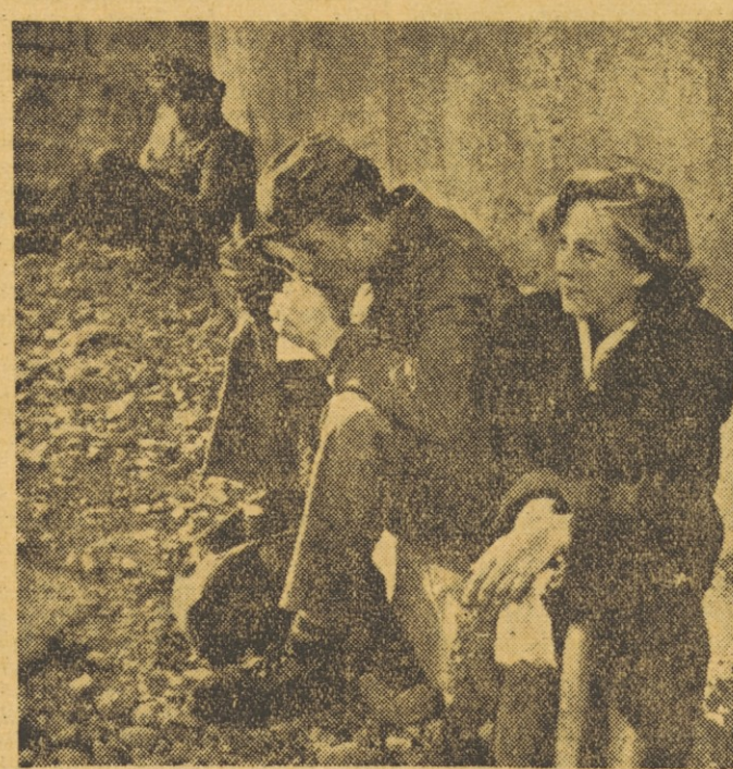
Tole je prizor iz delavske »restavracije« v tržaškem pristanišču. Res! Več tisoč delavcev ladjedelnice so. Marka takole obeduje...

Iz Pakistana poročajo, da so se 22. marca uprli delavci papirnice v Candragoni (Vzhodna Bengalija). Policija je posegla in pri tem je bilo ubitih 13 oseb, 35 pa težje ranjenih. Tovarna papirja je največje industrijsko podjetje v Vzhodni Bengaliji, deželi, ki je še zelo zaostala. Vzroki upora delavcev papirnice v Candragoni nam še niso znani.