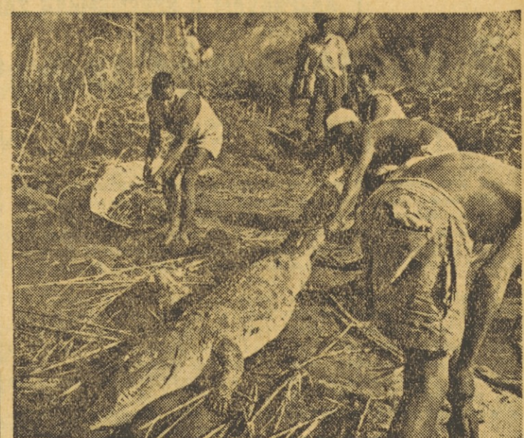
Tri metre dolgega krokodila vlečejo iz vode. Krokodilova koža je namreč tako občutljiva za vročino, da morajo mrto žival hraniti v vodi vse dotlej, dokler kože ne snamejo

— Žal nam je, toda mi potrebujemo pravnika z večletno prakso. — In kaj naj delamo mi, ki prakse še nimamo? — Zaposlite se.