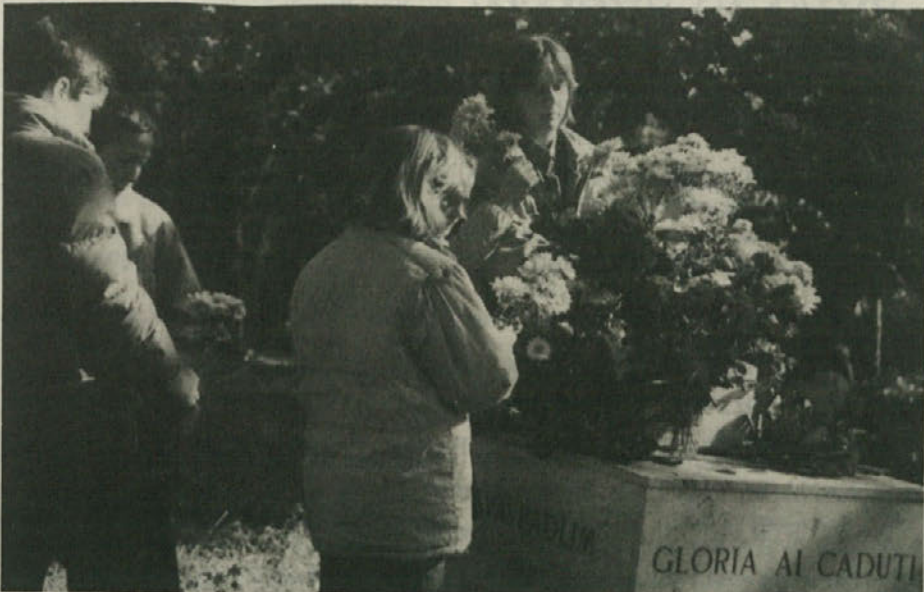
Ob 1. novembru se povsod poklanjamo spominu žrtvam vojne. Na sliki slovesnost ob začasni plošči, kjer bi moral biti postavljen spomenik padlim od Sv. Anc. iz Škednja in s Kolonkovca.