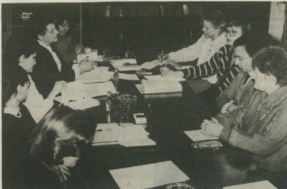
Pred tednom dni je bila pri deželnem vodstvu KPI na obisku delegacija Sekcije za vprašanja žensk in družine pri Marksističnem krožku CK Zveze komunistov Slovenije.

prav tako pa je sama imenovala stopnje višjih uradnikov. To prakso je v državno-pravnem pogledu potrdila tudi posebna »Naredba celokupne vlade o prehodni upravi v ozemlju Narodne vlade SHS v Ljubljani« (Naredba o prehodni upravi), ki jo je v sporazumu z Narodnim Vijećem 21. novembra 1918 razglasila Narodna vlada. Po tej naredbi je bila za Slovenijo prenesena vloga Narodnega Vijeća kot nosilca vrhovne oblasti na Narodno vlado in to tako, da je Narodno Vijeće prepustilo Narodni vladi svojo vrhovno oblast za slovensko ozemlje. S tem je bila na slovenskem ozemlju Narodna vlada tudi v formalnem pogledu edina, popolna in pravno najvišja oblast in nosilka slovenske nacionalne suverenosti v Državi SHS.