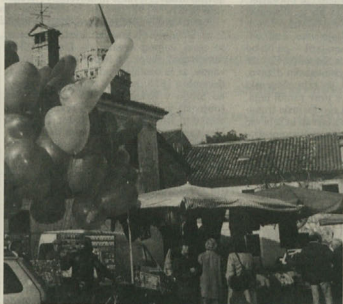
V nedeljo je Martinovanje ponovno napolnilo prošeške ulice. Ko smo Slovenci še bili pretežno kmečki narod, je bil to najbolj priljubljen praznik, saj je označeval konec večjih del na poljih.

Posebej kaže omeniti vlogo zadrug, še zlasti v kmetijstvu, ter kreditnih zavodov, ki so vsem drugim dejav-