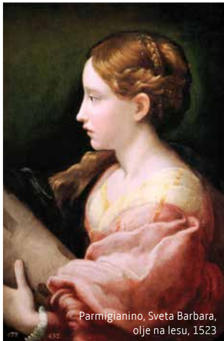
Parmigianino, Sveta Barbara, olje na lesu, 1523

T emni, mrzli december je poln svetlih praznikov. Že 4. decembra, na barbarino , so naši dedje odlomili vejico sadnega drevja, da je v topli sobi do božiča vzbrstela, zacvetela in krasila božično praznično mizo. Odganjala je zimo in klicala pomlad.