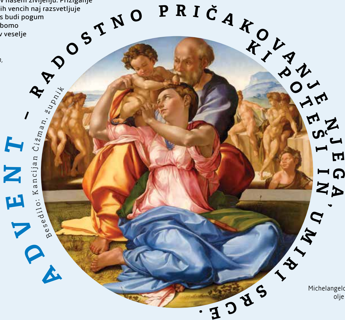
Michelangelo, Doni Tondo, olje na lesu, 1507

Pred nekaj tedni smo premaknili uro na zimski čas. Na to smo se že navadili, saj že vrsto let dvakrat v letu »nastavimo« uro na dogovorjeni čas. Morda nas je kdaj presenetilo, da smo zvečer pozabili in smo se zjutraj začudeno spraševali in ugotavljali, da je nekaj narobe. Ko premaknemo kazalce v jeseni na zimski čas, imamo tako dodatno uro za spanje in počitek. Ta premik kazalcev nam vsaj za hip da občutek, da smo mi gospodarji časa. A to je kratkotrajno, saj nam potem zopet čas »meri« naše aktivnosti in dejavnosti v vsakdanjem življenju.