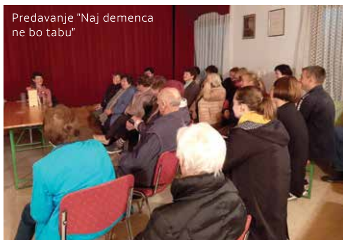
Predavanje "Naj demenca ne bo tabu"