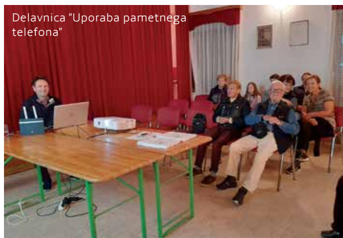
Delavnica "Uporaba pametnega telefona"

V naši humanitarni dejavnosti bomo vztrajali. Tudi letos bomo za praznike obiskali starejše, bolne in invalide.