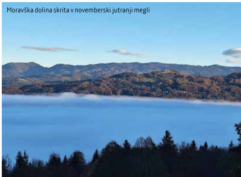
Moravška dolina skrita v novemberski jutranji megli

J a, priznam, je kaj čudnega, če smo lokal-patrioti? Slovenski patriotizem je na Moravškem nadgrajen z moravškim domoljubjem, ljubezen do domovine dopolnjuje naša predana pripadnost Moravški dolini, njenim lepotam, zgodovini, kulturi, vrednotam. Če je slovenska domovina naša očetnjava, je Moravška dolina s svojim okoliškim hribovjem naša ožja domovina, naša velika družina. Slavna preteklost naših prednikov še danes določa naše delovanje: v njih prepoznavamo naše skupno ime in tradicijo, ki nas zavezuje k nadaljevanju pradačne preteklosti. Skupno je vse materialno in duhovno bogastvo Moravške – zemlja, gozdovi, travniki, voda, zrak, sadovi narave. Moravška dolina je naša skupna dediščina, ki si jo je treba tudi skupaj deliti . Smo njeni začasni skrbniki, kar od nas terja mirno sobivanje in spodbujanje dobrodejnih oblik skupnega ter omejevanje škodljivih oblik.