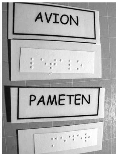
SLIKA 2 Igra spomin v Braillovi in običajni pisavi

da mu lahko pomagajo tudi starši. Poleg tega staršem vsak začetek tedna po elektronski pošti pošljem načrt dela za ves teden. Vanj zapišem cilje za posamezne predmete, ki jih mora otrok usvojiti. Starši tako lažje spremljajo šolsko delo in vodijo otroka pri učenju. Pri pripravi prilagoditev za slepega učenca si pomagam z elektronsko obliko učbenikov, ki sem jih ob posredovanju ravnateljice in knjižničarke dobila od nekaterih založb. To mi je delo močno olajšalo, saj vsega besedila ni treba prepisovati.