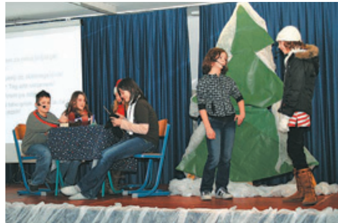
Tudi igrico smo uprizorili v nemškem jeziku.

Učenci so radi hodili k pouku nemščine, čeprav to zanje pomeni dve uri več na teden, ker morajo kljub povečanju števila ur v predmetniku obiskovati dve uri izbirnih predmetov. Zaključimo lahko le, da nam ni žal, da