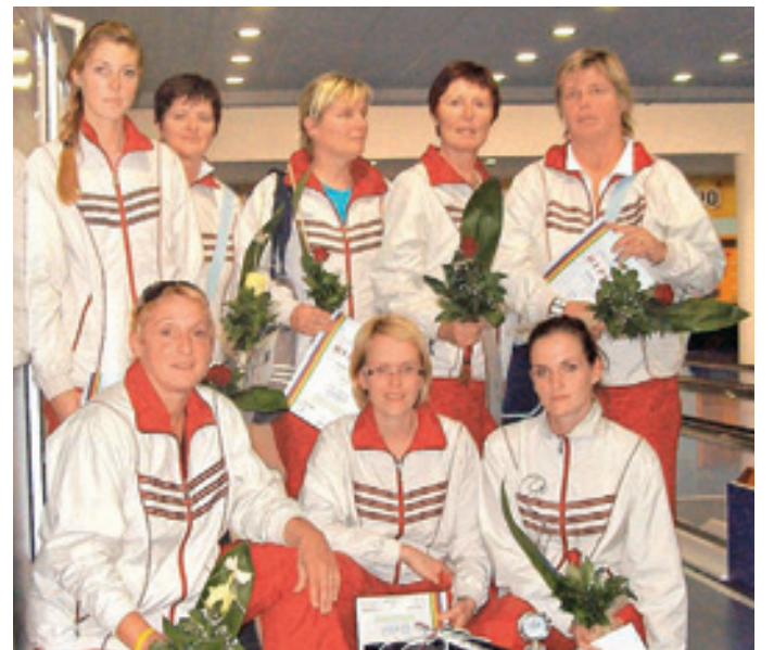
Kegljaški klub Kamnik