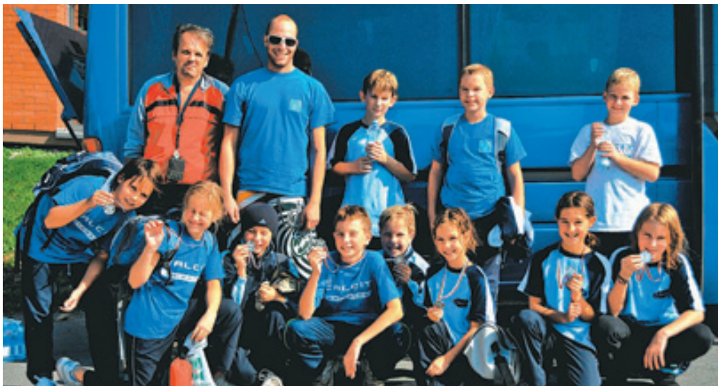
Člani 2. skupine PKK so uspešno opravili svojo nalogo ob otvoritvi plavalne sezone.

Čast za otvoritev nove tekmovalne plavalne sezone je tokrat doletela člani 2. skupine Plavalnega kluba Kamnik. Mladi plavalci so nalogo sprejeli resno in odgovorno ter se v soboto, 26. septembra, udeležili prve tekme v novi sezoni - 2. Pokala Ruš. Bazen v Rušah je našim plavalcem že dobro poznan, saj so se lani udeležili 1. pokala