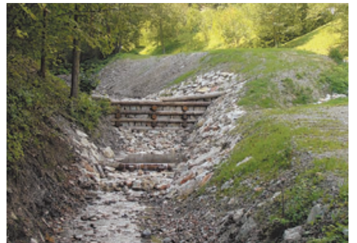
Urejena preklada na potoku Globovšči.

Dela so v zadnjih dveh letih po večini potekala v skladu s triletnim sanacijskim programom, ki ga je sprejela Vlada Republike Slovenije v letu 2007 na podlagi ocenjenega stanja na terenu ter škode po neurju in poplavih. V letu 2008 je bilo veliko narejenega na vodotoku Kamniške Bistrice v krajih Klemenčevu in Bistričica ter na pritoku Črnivca, uredil se je hudournik ob naselju Hruševka, v pripravi so bili posamezni projekti. V letošnjem letu so se pričela dela na potoku Motnišnica v Tuhinjski dolini, zgrajene so bile pregrade na potoku Globovšči in Bela, kjer so se zaključila tudi dela na jez. Tam so utrdili brežino ter rečno dno. V leto-