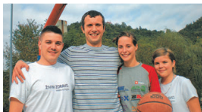
Miro z ljubitelji košarke na igrišču Šolskega centra Rudolf Maister, kjer je obiskoval srednjo šolo.

Ne, za kaj več kot klepet ob kavici ne najdemo časa, saj smo