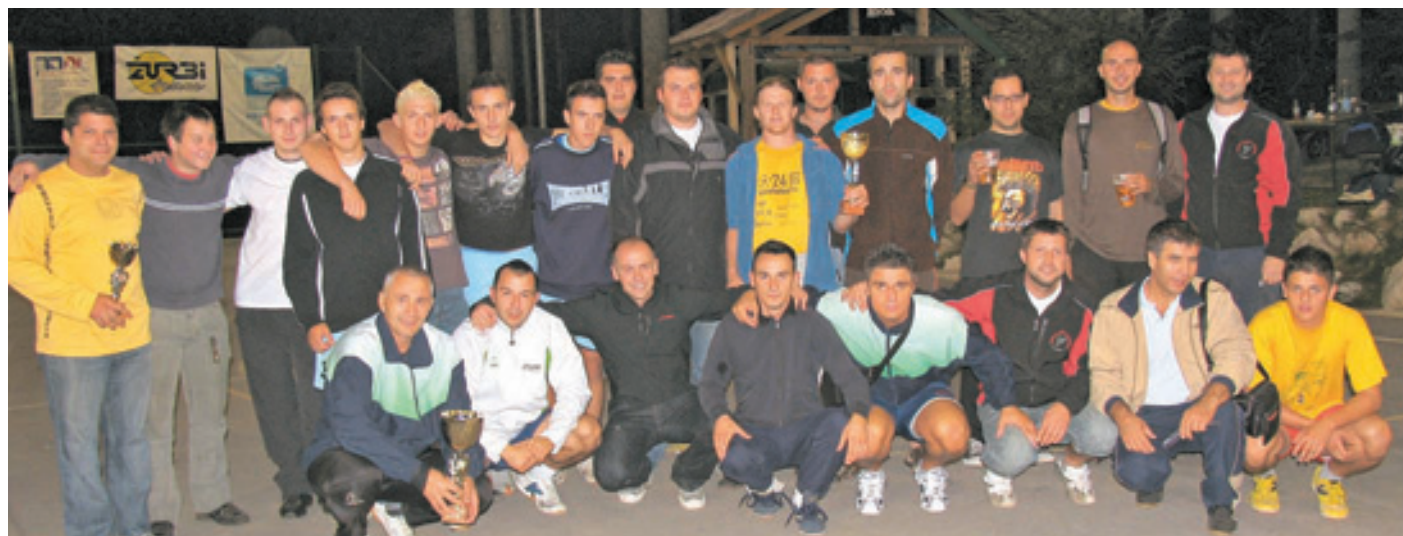
Zmagovalne tri ekipe.