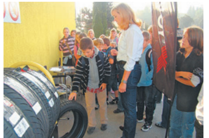
Skupaj pogledamo in potipamo kakšna je zimska in kakšna je letna pnevmatika.