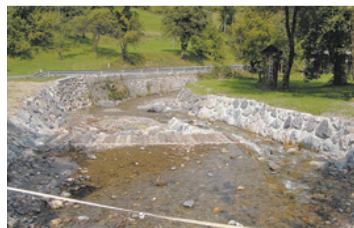
Obnovljen je jez na vodotoku Motnišnica v Beli.