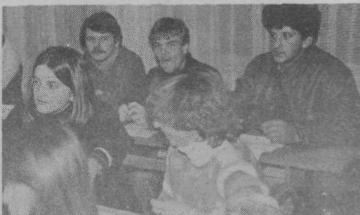
Z volilno programske konference OK ZSMS Grosuplje