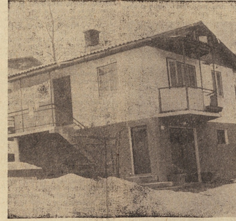
Idrija je eno samo gradbišče. Na vsakem koncu gradijo. Letos bodo spravili pod streho 68 stanovanj v družbeni gradnji.