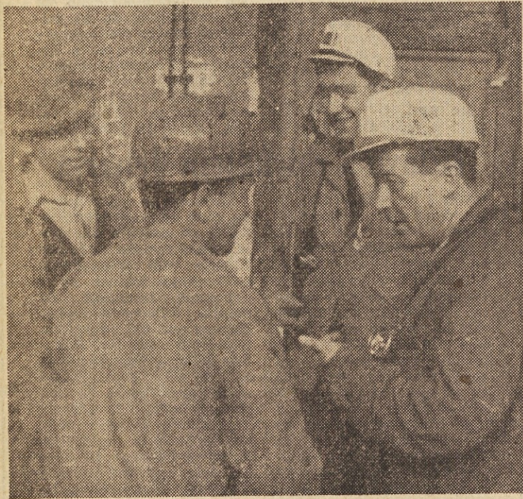
Zadnji pomenek rudarjev pred odhodom na delo v jamo.

Učinki idrijskih rudarjev so že zdaj izredni. Rudar v Idriji izkoplje na »dnino« 4,5 tone rude. Po svojem učinku je za seboj pustil že italijanske rudarje v rudnikih živega srebra.