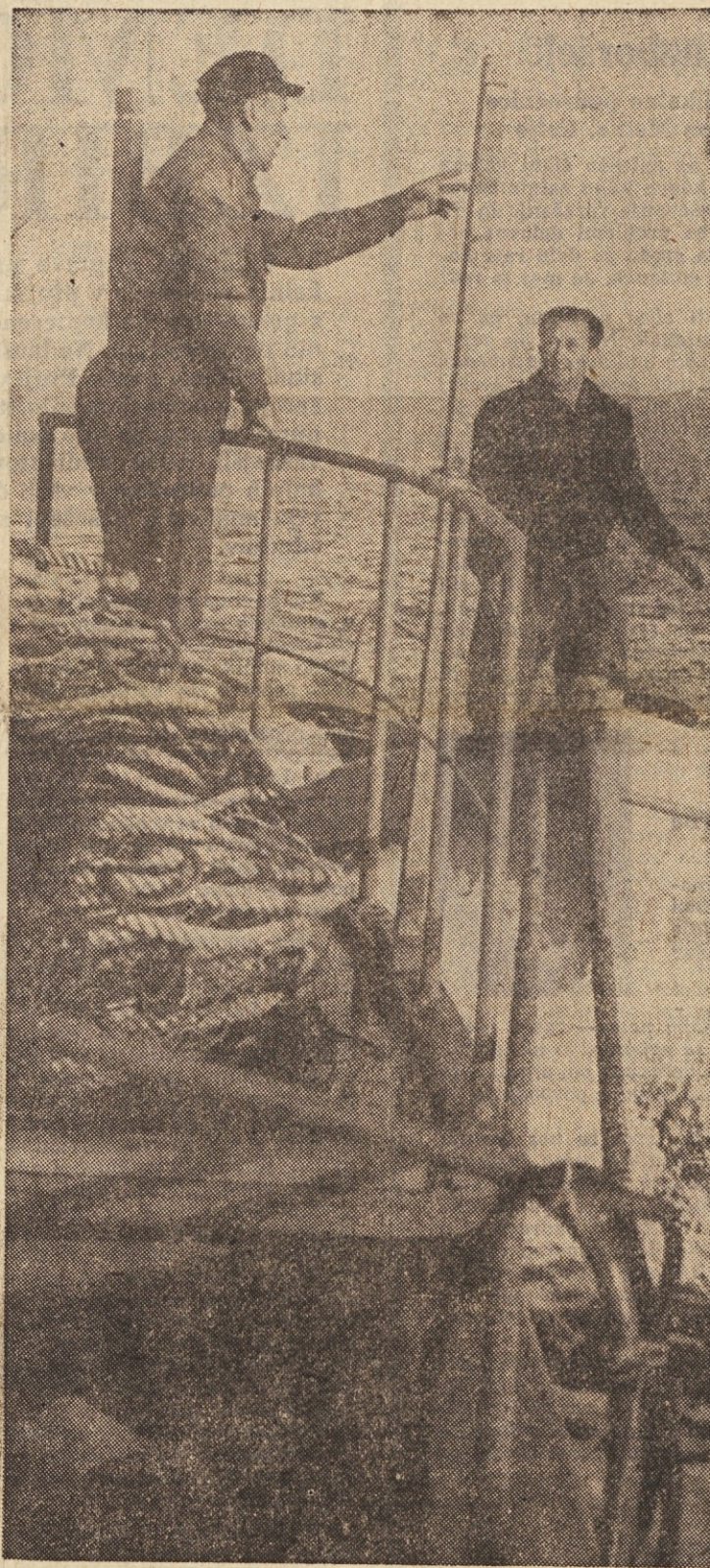
PO USPEŠNEM LOVU — DOMOV