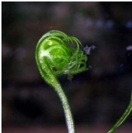
Slika 6: Zimski brst (turion) mešinke z Blok, Bloška planota (foto J. Slatner) Figure 6: Utricularia sp. – turion, Bloke plateau (photo J. Slatner)

Mešinke se razmnožujejo vegetativno, saj prezimujejo v obliki zimskih brstov (turioni), ki jih razvijejo jeseni (SLATNER 2019: 97). Zimski brsti vrst U. minor in U. bremii se med seboj ne razlikujejo dovolj, da bi lahko na podlagi njihove oblike ali velikosti razlikovali med obema vrstama. Pri obeh vrstah so veliki 1–5 mm in prekrti z vsaj tremi listi (slika 6). V plodu Bremove mešinke na povirju Godičevo nismo našli semen, kar potrjuje dosedanje ugotovitve, da se rastlina verjetno razmnožuje samo vegetativno (ASTUTI 2016).