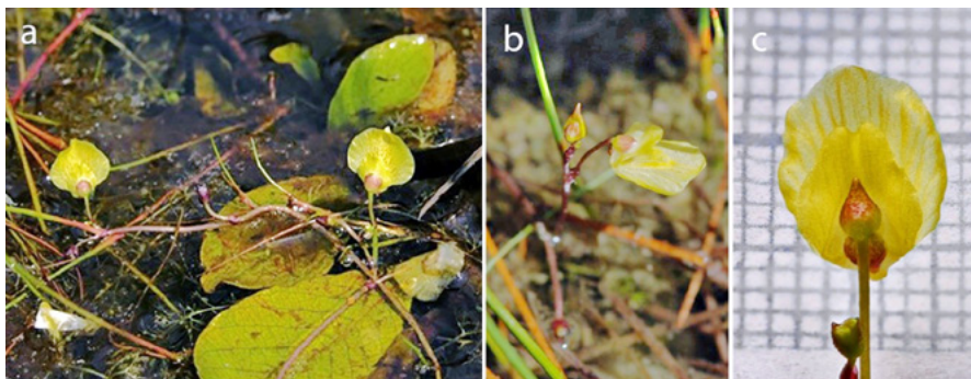
Slika 1: Cvet Bremove mešinke, Bavarska (1.a), cvet male mešinke, Godičevo – Bloška planota (1.b), cvet mešinke z Blok, Godičevo – Bloška planota (1.c)

Velikost in zgradba cvetov sta pri Bremovi mešinki pomembna morfološka znaka za razlikovanje od male mešinke (FLEISCHMANN & SCHLAUER, 2014) (slika 1.a). Cvet Bremove mešinke ima spodnjo ustno cvetnega venca okroglo, ploščato in ravno ob robu. Njena širina je lahko večja od dolžine. Premer cvetov pri mešinkah pod vasjo Godičevo je 6 mm in je v primerjavi s podatki iz literature 8–10 mm (JOGAN 2007: 583), premajhen za U. bremii . Zgornja ustna pri Bremovi mešinki je le malo manjša od spodnje ustne cvetnega venca, čašni listi so zaobljeni (slika 1.a). Pri U. minor so cvetovi veliki 6–8 mm, spodnja ustna cvetnega venca je jajčasto podolgovata in ob straneh z navzdol zavrtimi robovi. Zgornja ustna cvetnega venca komaj prekriva izbočen in obarvan del spodnje ustne, čašni listi so priostreni (slika 1.b). Raziskava je pokazala, da imajo cvetovi mešinke s povirja pod vasjo Godičevo morfološke znake obeh mešink, male in Bremove (slika 1.c).