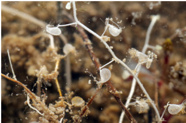
Figure 4: U. minor – terminal segment with setula (4.a), U. sp. from Bloke plateau – marginal teeth (Z) with setulas (Š) (4.b)

Slika 5: Mešinka z Blok – brezbarvni poganjki v mulju