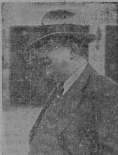
Jouhaux, povzročitelj in vodja zadnje ponesrečene in od Moskve naročene generalne stavke v Franciji

Krčevina pri Vurbergu. V zadnjem času prihajajo iz vasi onstran Drave, in to: Slovenja vas, Hodoše, ljudje, odnosno fantje v naše kraje po-