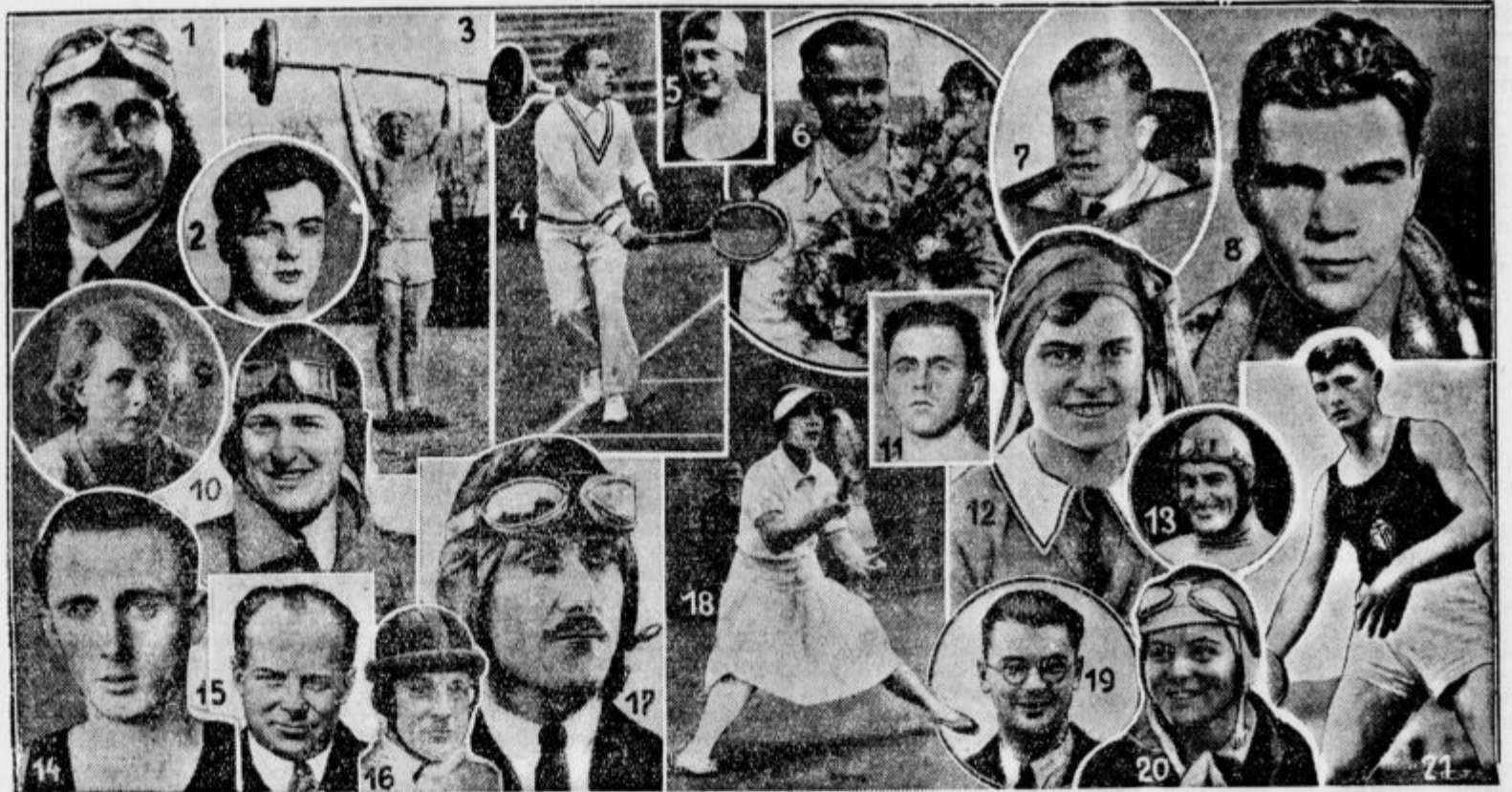
Naša slika kaže glavne sportne junake, ki so v letu 1931 dosegli pomembnejše uspehe. 1. Wolfgang von Gronau je preletel v 2 etapah Severni Atlantik. 2. Deutsch, evropski prvak v hrbtnem plavanju na 200 m. 3. Monakovčan Ismayr, svetovni rekorder v olimpijskem troboju dviganja uteži. 4. Nüßlein, nemški profesionalni prvak v tenisu. 5. Nemka Herta Wunder, nova svetovna rekorderka v plavanju 100 m prsno. 6. Italijan Caracciola, najuspešnejši avtomobilski dirkač v letu 1931. 7. Groenhoff, novi svetovni rekorder v trajnostnem poletu za brezmotorna letala. 8. Boksar Maks Schmeling je uspešno branil svoje prvenstvo proti polmetla iz Berlina v Tokio. 11. Evgen Mühberger je v lahki teži postavil nov svetovni rekord v dviganju uteži. 12. Hanni Köhler je na motornem kolesu prevzela vso Prednjo Indijo. 13. Anglež Campbell je dosegel z avtomobilom hitrost 395 km na uro. 14. Nemški tekač Sühning je na 5000 m s 14:49,5 postavil nov nemški rekord. 15. Ernst Udet, najboljši umetniški letalec sveta. 16. Walter Sawall, svetovni kolesarski prvak za leto 1931. 17. Anglež Stainsforth je pri tekmovanju za Schneiderjev pokal dosegel z hidroplanom hitrost 72 km na uro, pa se je kmalu nato smrtno ponesrečil. 18. Cilly Auser, najboljša teniška igralka sveta. 19. Nemeč Wolf Hirth je z brezmotornim letalom krožil nad newyorškimi nebotičniki. — 20. 19letna nemška letalka Elli Beinhorn je sama preletela Afriko v majhnem sportnem letalu. 21. Nemeč Silverl, drugi najboljši deseterbojnik sveta.