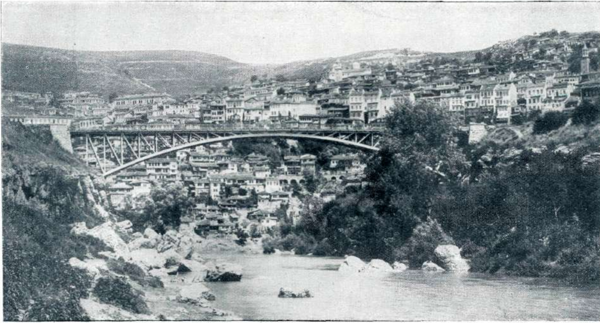
TRNOVO (nekdanja bolgarska prestolnica).