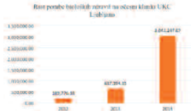
Graf 2: Poraba bioloških zdravil na Očesni kliniki UKC Ljubljana v obdobju 2012 do 2014

Graph 1: Cost of biological medicines compared to total medicines cost in UMC Ljubljana for years 2012 - 2014