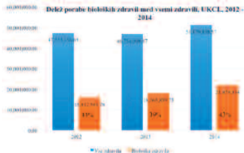
Graf 1: Delež porabe bioloških zdravil med vsemi zdravili v UKC Ljubljana v letih 2012 – 2014

Graph 1: Cost of biological medicines compared to total medicines cost in UMC Ljubljana for years 2012 - 2014