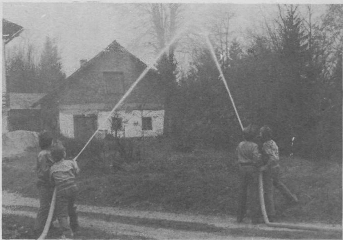
Trenutek, ko je pritekla voda na Plešivici. Na sliki so pionirski GD Žalna