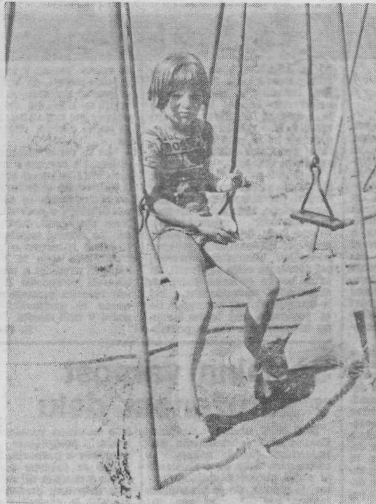
Popoldanska malica na gugalnici.