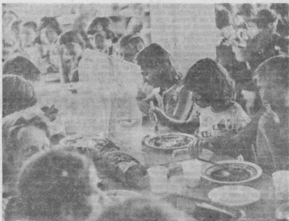
Prehodna ladžica pristane pri skupini, ki je pri jedi najbolj tiha. Govorjenje namreč povzroča veter, ki ladžico kaj rado odpihne v vode pridnejshe (tišje) skupine.