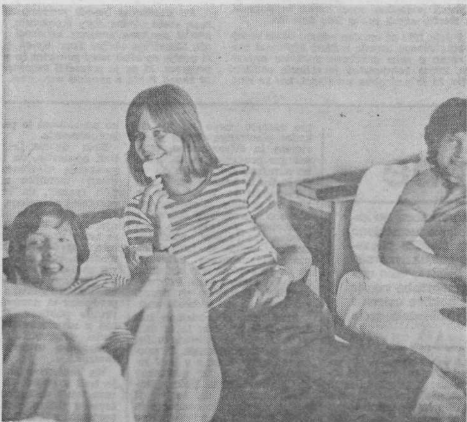
Lučka z lučko pri aktivnem počitku.