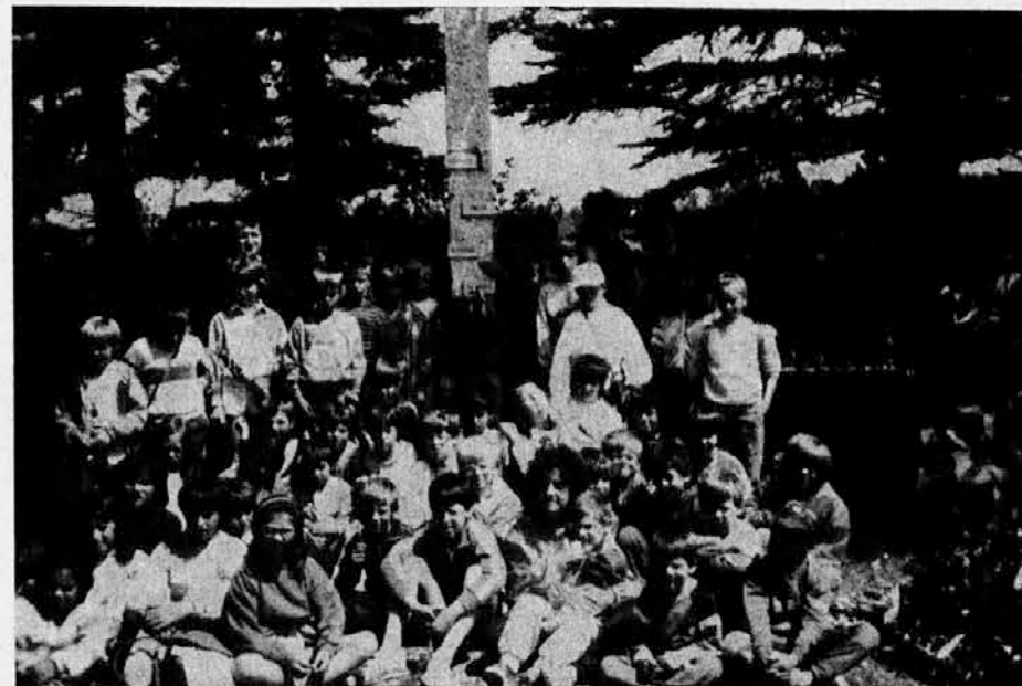
Otroci letošnje kolonije Slokada v Dragi so v juliju počastili spomin bazoviških junakov s tem, da so se poklonili njihovega spomeniku

V vsej pravoslavni metropoliji Kišinev je danes odprtih za obrede le še 16 cerkva in en ženski samostan, nekoč pa je bilo na območju sedanje republike Moldavije vernikom na voljo kar 1.090 pravoslavniških cerkva in 29 samostanov. Do danes jih je veliko razpadlo ali so popolnoma porušeni, nekatere pa so spremenili v skladišča, športne dvorane, muzeje. Najstarejšo cerkev v vasi Kobilnja so poleti 1985 preuredili v kolhozni muzej.