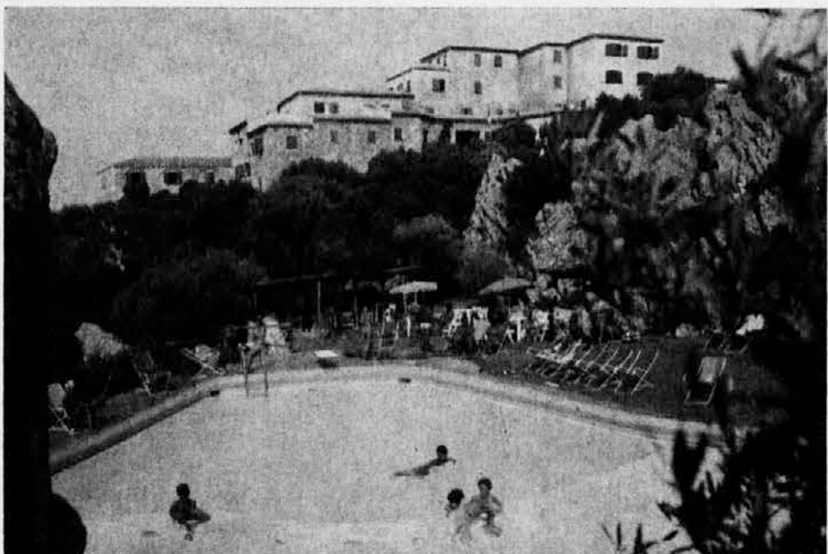
Hotel S. Pantaleo, postavljen na granitne sklade, kjer smo dvakrat prenočili. V bližini je svetovno znana Smaragdna obala

Italija je dežela, ki ima največ romarskih krajev. Naštevajo jih nad 1.500. Svetovno znane so Marijine božje poti v Loreto, v Pompejih, v Sirakuži na Siciliji. Izredno obiskana je bazilika sv. Antona v Padovi. Osrednjo privlačnost pa ima Rim z grobovi apostolov sv. Petra in Pavla. Vsako leto obišče veliko število romarjev Assisi z grobom sv. Frančiška in s spominskimi kraji njegovega delovanja.