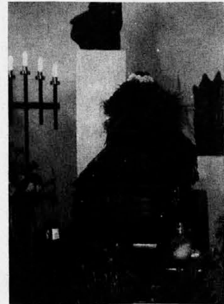
Krsta s pokojnikovim truplom

Pogled na Goršetovo domačijo, kjer je še do nedavna pelo kiparsko dletje, je bil naravnost pretresljiv: tišino so prebadali posušeni hodi in kosi lesa, ki so pričali o Goršetovih neusahljivih načrtih. Med