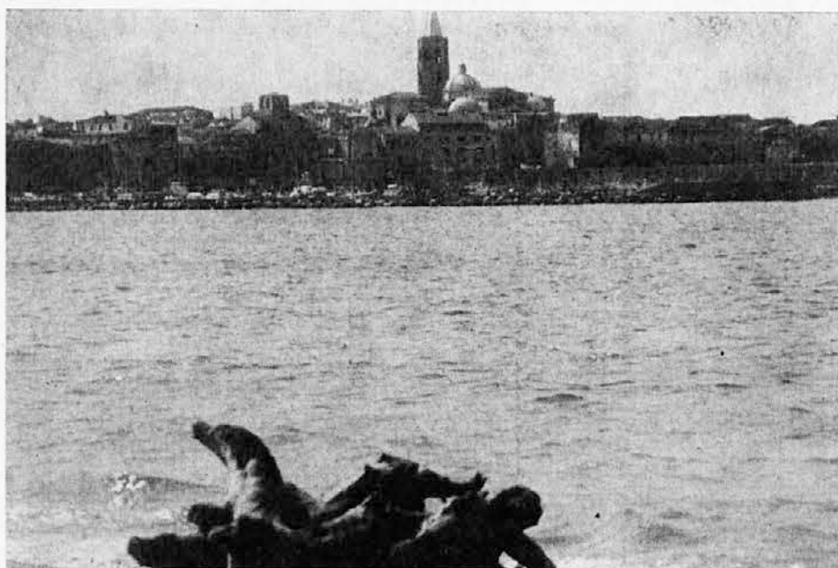
Mesto Alghero, kjer domačini govorijo med seboj katalonsko in so vsi javni napisi dvojezični (zakaj to pri nas še ni mogoče?)

Naslednji dan smo v avtobusu šli nazaj proti severu do pristanišča Palau, kjer smo se vkrkali na trajekt, ki nas je v pol ure prepeljal na otok Maddaleno, kjer je mesto (12.000 prebivalcev) enakega imena. Po nasipu, ki veže mesto z manjšim otokom Caprero, smo dosegli kraj, kjer je znani italijanski revolucionar Garibaldi živel od leta 1856 do svoje smrti 2. junija 1882. Otok je sedaj državna last