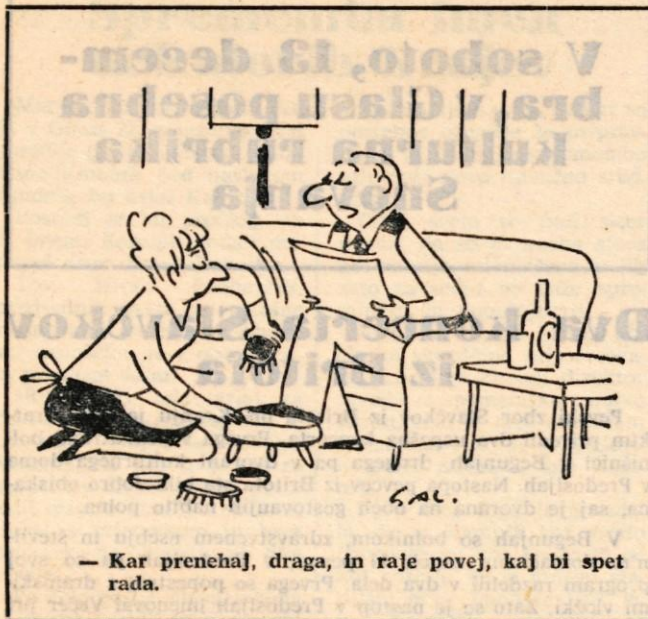
— Kar prenehaj, draga, in raje povej, kaj bi spet rada.