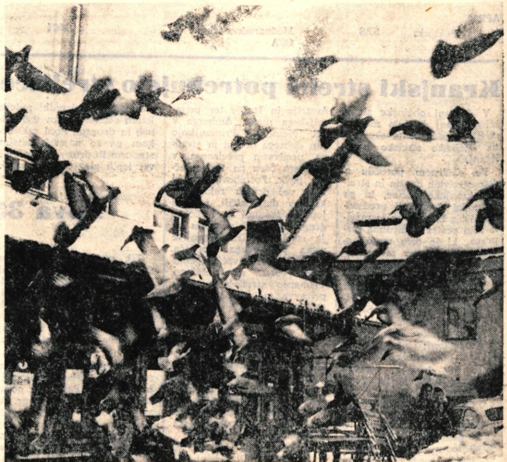
Zima je precej neprijeten čas tudi za pernate prijatelje. V ponedeljek je naš fotoreporter po krajšem obhodu v Kranju videl, da na običajnih mestih ni krmilnih hišic. Zato pa je bil toliko večji ptičji živ žav na kranjski tržnici. Vendar na smo včeraj (torek) ob 13. uri že opazili krmilne hišice.