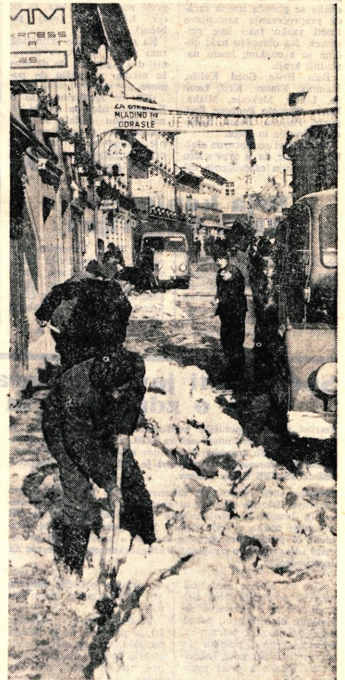
V Prešernovi ulici v Kranju so v ponedeljek že čistili novo zapadli sneg, vendar pa je še vedno precej ulic neočiščenih. Upamo, da je letos komunalna služba bolj pripravljena na zimo.