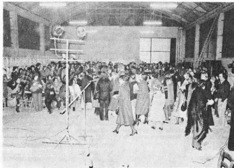
Praznik žen v fabriki na Cemurju

Una serata importante, dunque, per la cultura e per il progresso della donna nella nostra società.