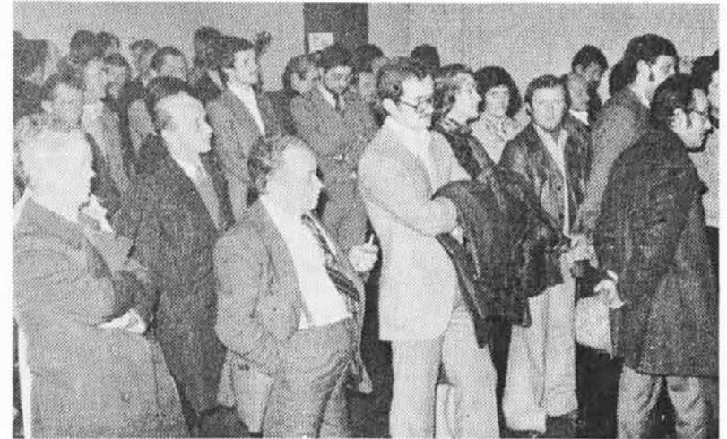
En del bralcev Novega Matajurja posluša na srečanju v Čedadu kulturni program

Tudi Novemu Matajurju so bila zaprta vrata v javni dvorani v Št. Lenartu in je moral praznovati izid svoje 100. številke v drugem kraju. Gotovo, se ne ve, koliko to pomaga svobodnemu kroženju idej in sami turistično-trgovski aktivnosti v Št. Lenartu, kjer se poskuša prepovedati ljudsko udeležbo k širši kulturni dejavnosti. Je treba tuti pojasniti, da bolj kot župan, je KD tista, ki si je hotela prevzeti odgovornost za kar se je zgodilo in je to storila tudi s potvarjanjem dejstev v tiskanem listku, ki ga je poslala med ljudi: «odklon» KD daktiran samo dva dni kasneje, potem ko smo mi dobili pismo, je samo smešen izgovor, ker vemo, da KD govori v tej dvorani, kadar hoče, drugi ne smejo.