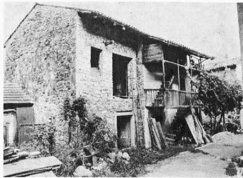
Hiša v Osnjem

nega sodelovanja v pokrajinskem svetu tako med konferenco kot v konkretnem naporu za izboljšanje gospodarskega in družbenega položaja Slovencev. Novi Matajur poziva bralce, prijatelje, društva, sekcije Zveze emigrantov, sekcije demokratičnih strank, občine in šole za aktivno, zavzeto, stalno in tvorivo angažiranost ob tako pomembni priložnosti kot je videmska konferenca.