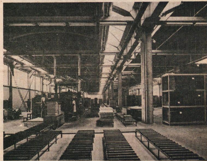
VELIKI MONTAŽNI OBJEKTI BREZ PREDELNIH STEN OMOGOČAJO UVEDBO SODOBNE ORGANIZACIJE DELA V NOVI TOVARNI POHIŠTVA

Prizadevnemu kolektivu, ki spada med največje proizvajalce pohištva v Jugoslaviji, ob tej priložnosti od srca čestitamo!