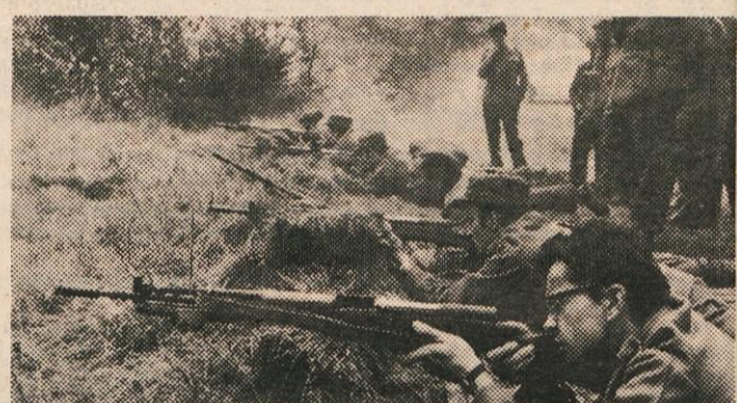
STAREŠINE PARTIZANSKIH ENOT MED STRELJANJEM S POLAVTOMATSKO PUŠKO

Menili so, da bi morale biti take vaje večkrat, saj bomo le na ta način ohranili in okrepili našo obrambno pripravljenost. Mnogi izmed starešin so prvič streljali s tem orožjem, vendar niso bili redki rezultati z vsemi petimi zadetki.