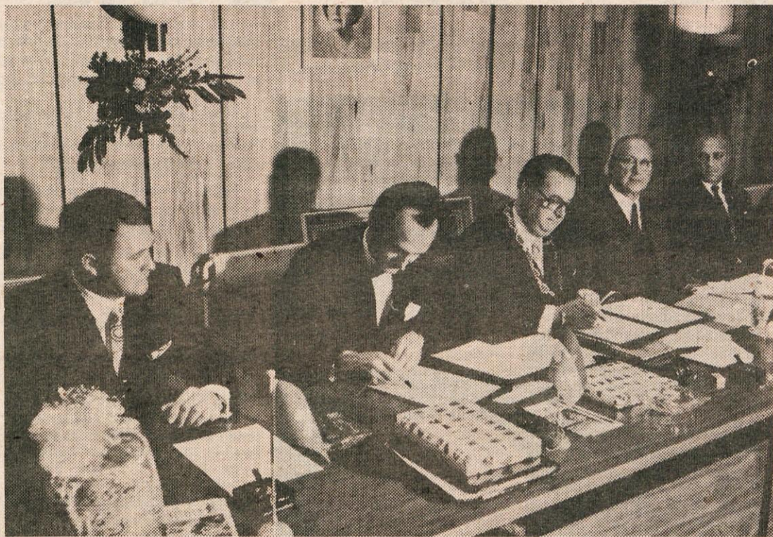
MED PODPISOM PROTOKOLA PRIJATELJSTVA, KI SO GA V MESTNI HISI V GENDRINGENU PODPISALI ŽUPANI OBČIN KERNS IZ ŠVICE, KAMNIKA IN NIZOZEMSKEGA GENDRINGENA

Ze od nekdanje Nizozemske znana po svojih kolesih. Tu brca pedale vsak; od najmanjšega otroka, ki je skoraj še v plenicih, do starčka, ki komaj še stoji, s kolesom se pa vendarle še lahko pelje. Avtomobilov v manjših krajih ni videti veliko, zato pa se ob kolo lahko spotakne vsak hip. Temu primerno pa so opremljena tudi stanovanja. Ko gradijo stano-