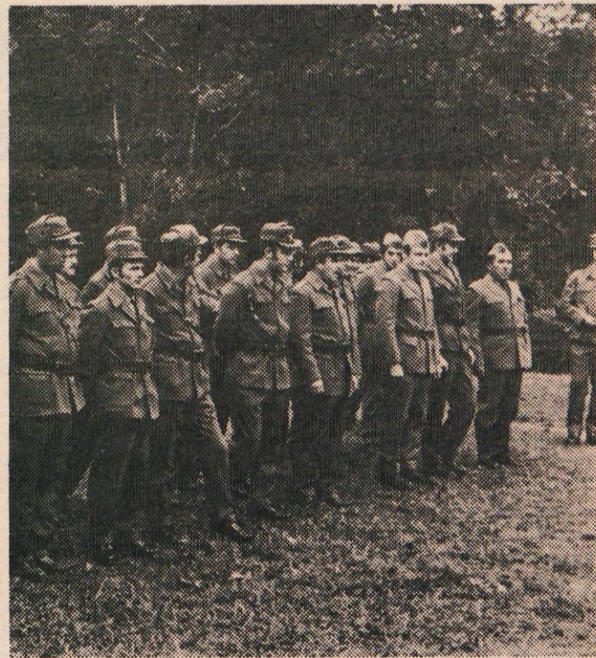
OBČINSKA SKUPŠČINA IN DRUŽBENOPOLITIČNE ORGANIZACIJE ČESTITAJO OB 30-LETNICI USTANOVITVE NAŠE ARMADE VSEM PRIPADNIKOM PARTIZANSKIH ENOT, REZERVNIM VOJAŠKIM STAREŠINAM IN PRIPADNIKOM ENOT JUGOSLOVANSKE LJUDSKE ARMADE

V javni razpravi je prevladalo mnenje, da je subvencioniranje stanarin lahko le začasen ukrep in da je treba čimprej z višjo produktivnostjo in boljšim gospodarjenjem zagotoviti take osebne dohodke, da bodo občani lahko z varčevanjem prišli do lastnih stanovanj.