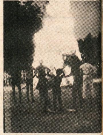
PRIJETNI SO BILI VEČER OB TABORNEM OGNJU

Pri njegovem odgovornem delu mu želimo veliko uspeha!