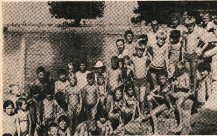
NAŠE NAJMLAJŠE SO NA MORJU OBISKALI PREDSTAVNIKI OBČINSKE SKUPŠČINE GOBEC, ZALOŽNIK IN VIDMAR