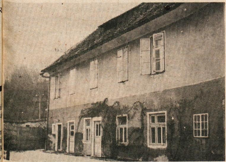
BO „MARJANCA“ KDAJ SLUŽILA KAMNIŠKIM UPOKOJENCEM?

Poleg tega, da so ti prostori na zelo primernem kraju v središču mesta, in bi bili lahko dostopni našim ostarelim občanom, je treba pripomniti tudi to, da bo v bližnji zgradbi nekdanje železniške postaje v kratkem začel delovati mladinski klub. Torej naj bi se v tem delu mesta v prihodnje razvilo kulturno in zabavno središče kamniške mladine in starejših občanov. Občinska konferenca SZDL sodi, da bo tako rešitev za naše ostarele občane pozdravila večina Kamničanov. F. S.