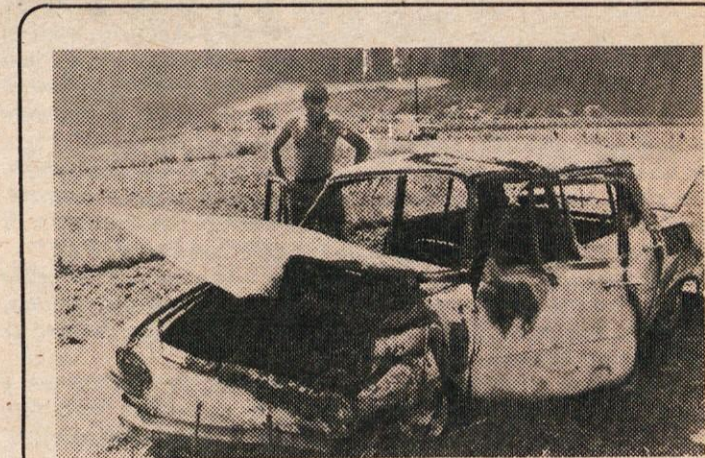
OSTANKI ŠKODE, KI JE SKUPAJ S FIATOM 1300 LETOS AVGUSTA ZGORELA NA PODGORSKI CESTI. Vzrok: nepremišljeno prehitvanje

slali v naše podjetje vprašalnik. Žal nam je, da je nanj odgovorilo le šest podjetij, zato podoba, ki jo ti podatki kažejo, ni stvarna. Vseeno pa se lahko seznanimo z velikimi potrebami po izobrazbi. Prepadi med zahtevano in stvarno izobrazbo naših delavcev je ogromen. Morda je večkrat tudi tu treba iskati vzroke za večino težav, ki nastajajo v naših podjetjih, pa ne samo v naši občini – v vsem našem gospodarstvu.