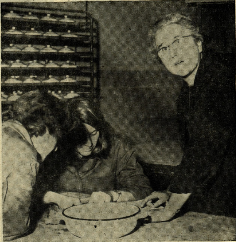
Kratek delovni posvet v dekor oddelku, ki je nedvomno ena najboljših oblik usposabljanja na delovnem mestu.