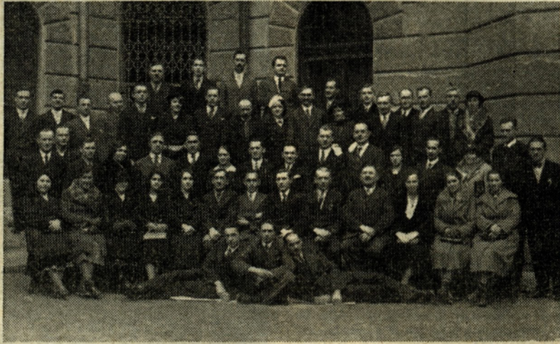
Slika predstavlja člane podružnice Zveze kovinskih delavcev Jugoslavije v Celju, delavske zaupnike in poverjenike. Posneta je bila leta 1935 na dvorišču Narodnega doma. Takrat je bila v Narodnem domu konferenca te delavske organizacije, na kateri so bili sprejeti pomembni sklepi.