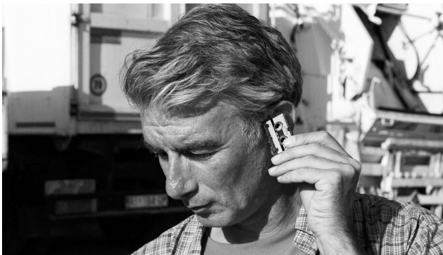
Mikrokaseta – najmanjša kaset, kar sem jih videl (2020)