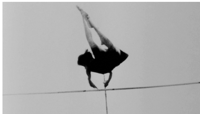
Kino-Pravda št. 10 (1922)

Avtorica tega zapisa se je FeKK-a letos udeležila v vlogi članice kritiške žirije, kar ima – poleg dejstva, da podeljene nagrade do neke mere odražajo tudi njene preference – dvoje pomembnejših implikacij. Prva je omembe vredno navdušenje nad vrhunsko organizacijo in drzno zastavitvijo obsežnega in v pandemskih razmerah posebej zahtevnega dogodka. Druga pa je posebna pozornost, s katero sem spremljala tekmovalni program. Letos sta ga sestavljala izbor 20 slovenskih produkcij (FeKK SLO) in 25