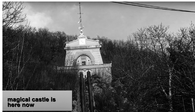
Magični grad je tu (2020)

kratkometražnih produkcij iz postjugoslovanskega prostora in prvič v zgodovini festivala tudi Albanije, Bolgarije, Grčije in Romunije (FeKK BAL).