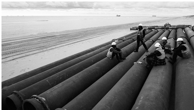
You Can't Automate Me (2020)