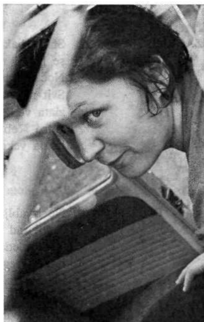
V dva človeka

in kako je divjalo to morje kako treskalo ob našo barkačo ob našo krsto