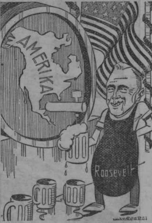
Odprava prepovedi alkoholnih pijač v Ameriki. Roosevelt nastavlja pivo.