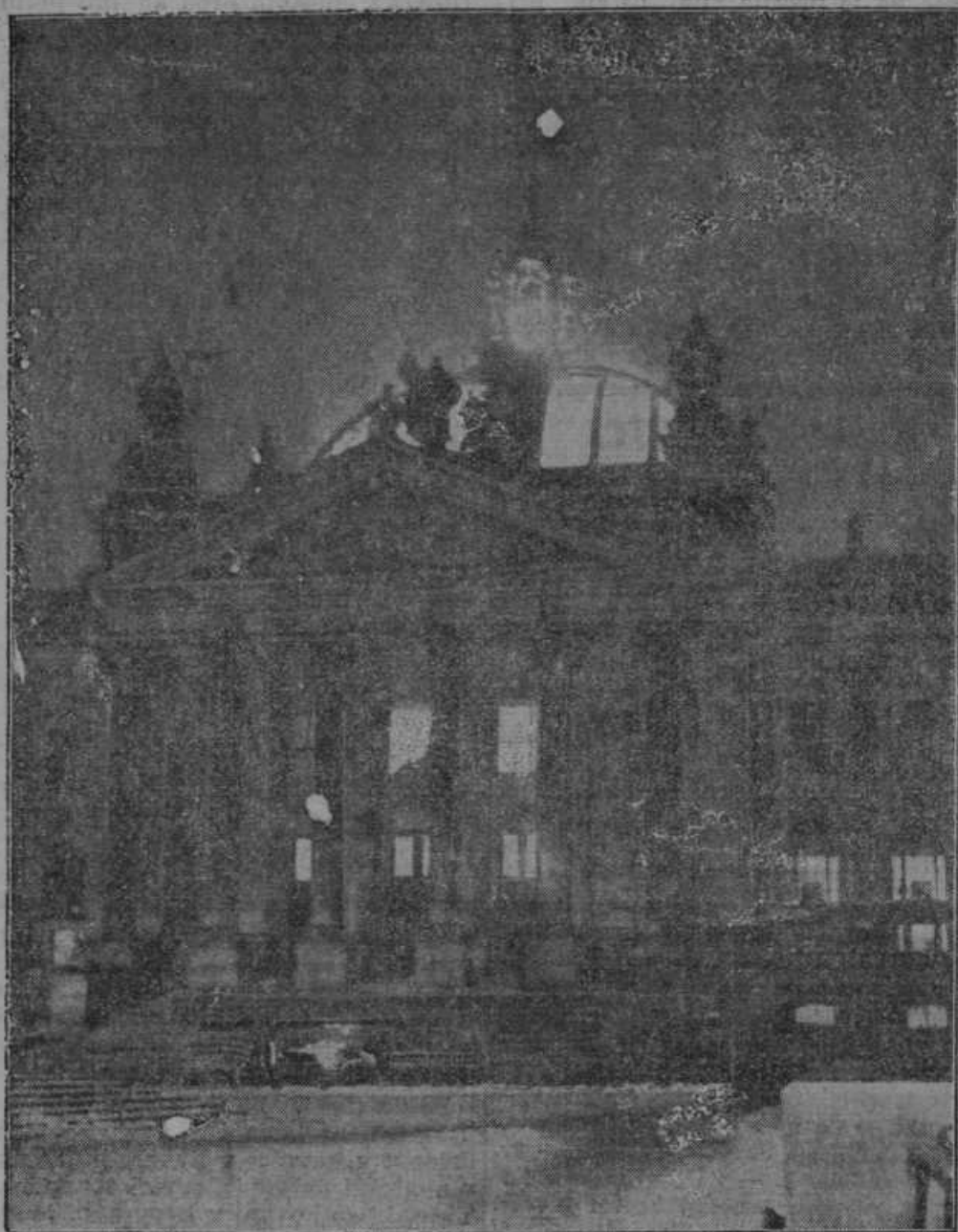
Požar nemškega parlamenta.