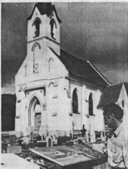
Iz likovne kolonije v Gornjem Gradu septembra lani