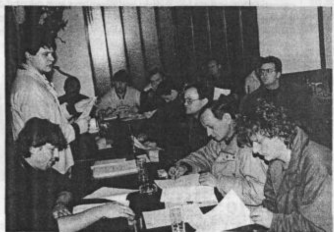
Lepo priznanje iz tujine za navijanje

Pravi navijači so s svojim športnim navijanjem v veliko oporo vsakemu klubu, saj pogosto ponesejo igralce k zeleni igri. V rokometu pravimo, da so njihov osmi igralec, v nogometu dvanajsti itn.