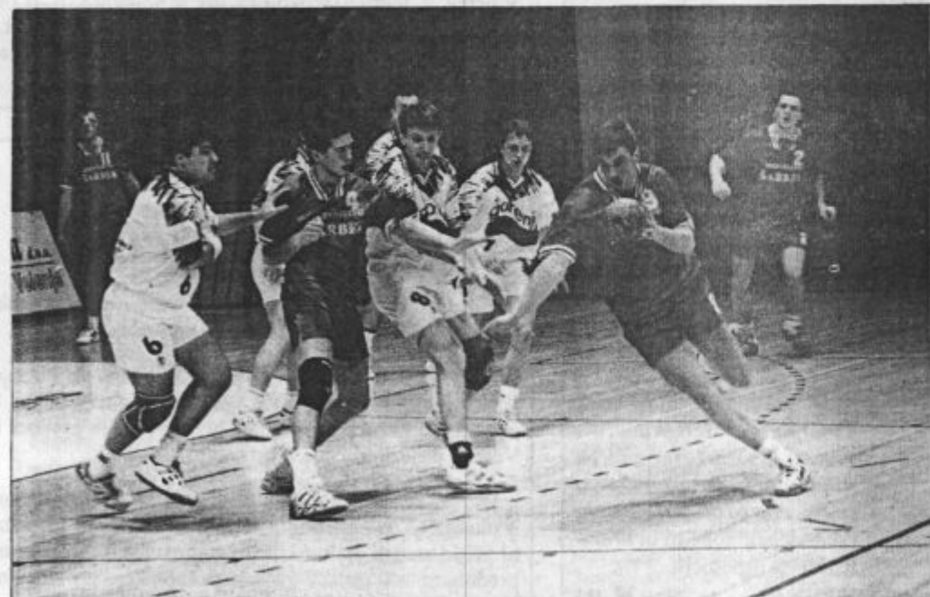
Seveda nismo pozabili igralci

Gorenje: Anžič, Krejan 2, German 3, Čater 6, Ocvirk 1, Ojsteršek 1, Plaskan 5, Khimtchenko 4, Semerdžijev 9 (1), Cvetko 2, Ilič 3, Lapajne. ■ vos