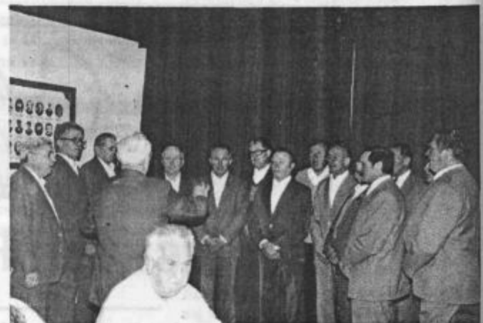
Moški pevski zbor DU Velenje se ponaša s 35-letnim delovanjem