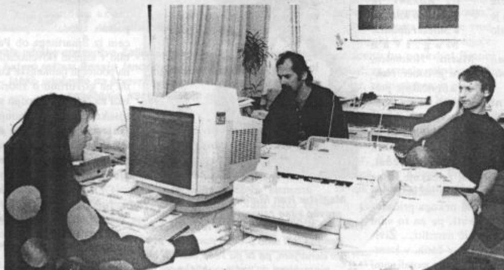
Rojevanje novega Almanaha. Neznani datum, znana ura: 23.56. (foto: Leši).

KUPIMO, POSREDUJEMO ZA ZNANE KUPCE BREZ PROVIZIJE VSE VRSTE NEPREMIČNIN!