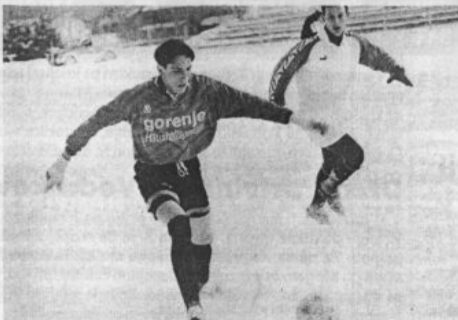
Bodo tudi uvodne tekme spomladanskega dela prvenstva v snegu?

V Rudarju so razmišljali, da bi odšli za nekaj dni v Tolmin, vendar so morali tudi ta načrt prečrtati