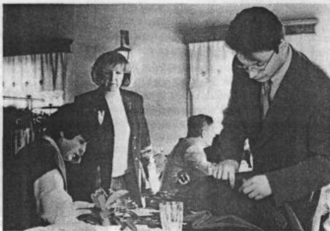
Zahteve kupcev so vedno ostrejšje

Ob tem je res, da so zahteve kupcev vsako leto višje in ostrejšje, te zahteve pa seveda pomenijo nižje cene in boljše plačilne pogoje, obenem pa se kupci vse pogosteje odločajo za nižje količine, zato so Elkrojevi napori za svetovnimi modnimi