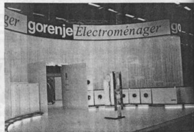
Razstavljeni prostor Gorenja je sodil med najlepše urejena na Confortecu 1996