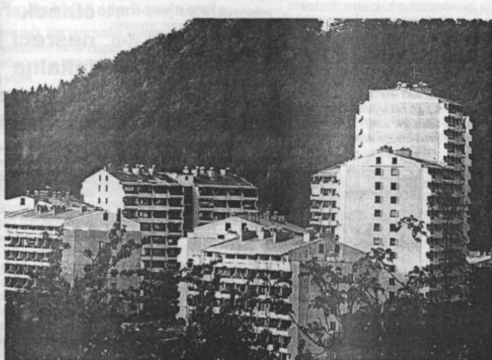
Veliki na hribu...