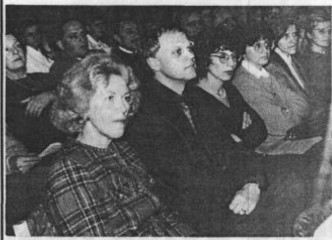
Udeleženci seminarja so znova ugotavljali vzročno povezavo med kajenjem in primarnim pljučnim rakom