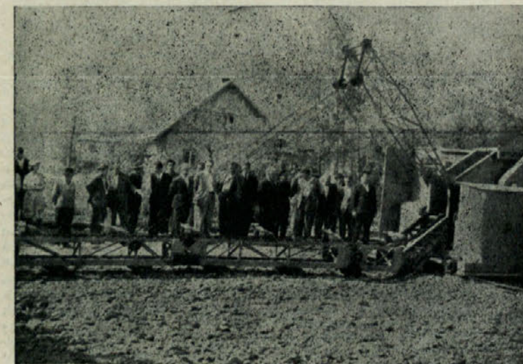
V Opekarni je začel obratovati nov bager

Kolonialna politika v Kongu je povzročila, da je svet zabredel v še večje težave, povzročila je smrt Daga Hammarskjölda, ki je opravljal svoje posle kot generalni sekretar OZN. Padel je v Rodeziji v Afriki z letalom, to je na tisti zemlji, na kateri se ljudje borijo za svobodo in enakopravnost življenja, kjer se bojuje pravica za nasiljem in napredek z zaostalostjo.