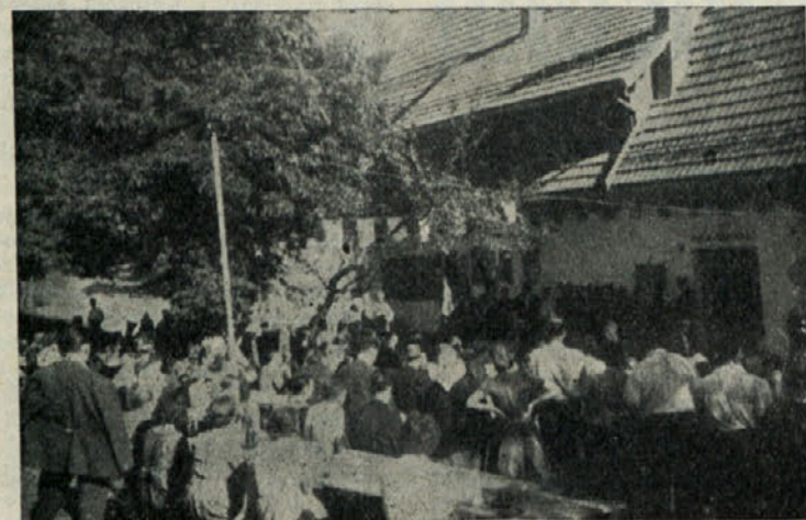
Spominski svečanosti na Travnici gori je prisostvovalo veliko ljudi

Trak na umetni sušilnici je prerezal predsednik ObLO Rib-