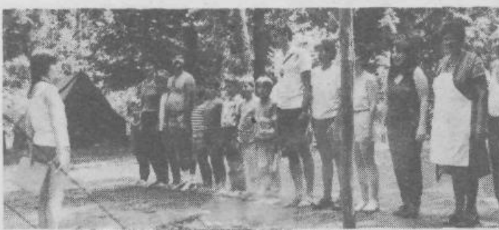
Kadar se v zbor postavi rezervni sestav...