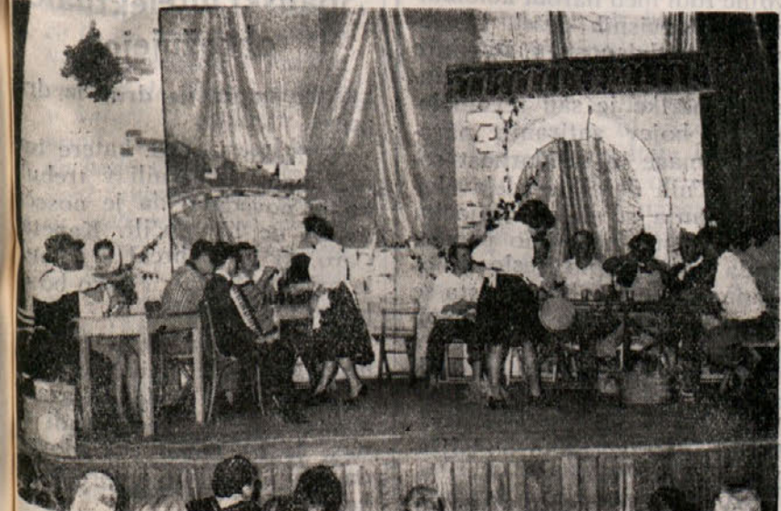
Prizor iz veseloigre „Na kriški osmici“, ki so jo uprizorili člani dramske skupine prosvetnega društva „Vesna“ v nedeljo na Opčinah. O priveditvi na Opčinah poročamo tudi na 4. strani lista.