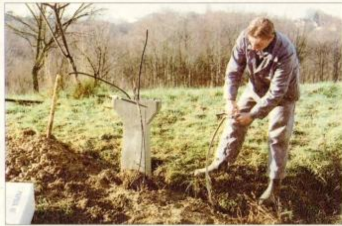
V minulem tednu so strokovnjaki podjetja Pap v juršinski občini v povezovalnih omaricah uredili že več kot polovico osnovnih priključkov.