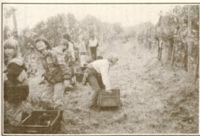
Tretješolci v trgatvi

Zbrali smo se ob 8. uri zjutraj. Kot za stavo so takrat začele padati prve dežne kaplje. Opremljeni s škarjami smo pričakali kamion, ki nas je po vijugasti cesti odpeljal v gorico. Pričakala nas je čudovita narava in tišina, ki ju je motilo petje klopotev in naš živjav. Razdelili so nam gajbe in v parih smo odšli v gorico. Med obiranjem grozdja smo peli vriskali in se sladkali z grozdem. Vesele trenutke je