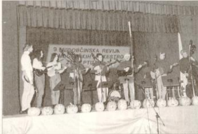
Gostitelji letošnjega tamburaškega srečanja so bili Cirkulančani.

Orkester Kulturnega društva Franceta Prešerna Videm pri Ptuj, ki je naslednik nekdanje-