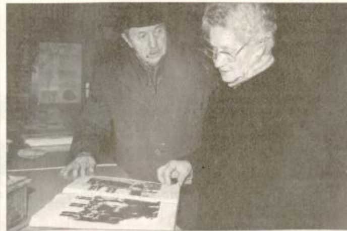
Razstava iz stare šolske kronike