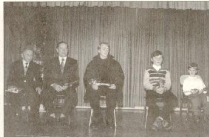
Pet generacij Stoperčanov predstavlja šolo v zgodovini in sedanjosti