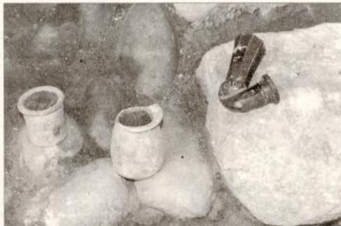
Med zanimivejšimi najdbami je (desno) tudi črna keramična pipa. Foto: M. Ozmeč

stene obzidja, ter linijo obrambnega jarka, ki ga je nekoč zapolnjevala voda, speljana iz Grajene. Ta se je nekoliko vzhodne-