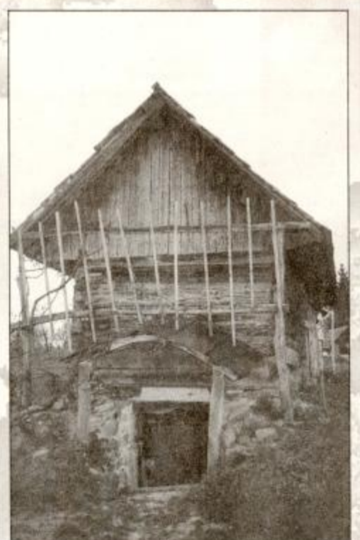
Jurkova viničarija - ena zadnjih, ki še spominjajo na nekdanji Kacjek.

Na Kacjeku oziroma Vinarju, razpotegnjenem grebenu z okoli 380 metri nadmorske višine, ki se razprostira v gričevnatem svetu podpohorskega pogorja med potokoma Čadramščico in Ložico in kjer prevladujeta vinogradništvo in sadjarstvo, je bilo v preteklosti več takšnih zidanic. V novejšem času so mnoge med njimi podrli in namesto njih zgradili nove, ki pa se po svoji obliki in načinu gradnje ne vključujejo v prijetno okolje goric.