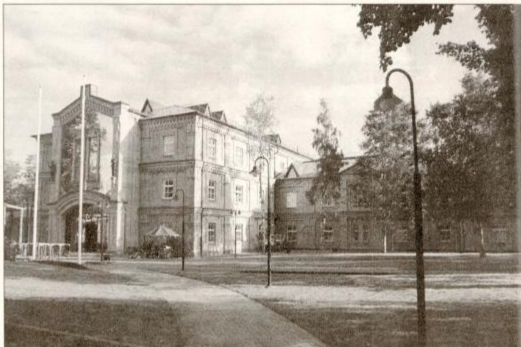
Granitovci so se preizkusili tudi v tujini. Na fotografiji je poslovni center v mestu Ventspils v Latviji.

Slovenjebistriško gradbeno podjetje Granit sodi po številu zaposlenih med srednje velika gradbena podjetja, po klasifikaciji Agencije za plačilni promet pa med velika. Na vprašanje, ali so trdno podjetje, pa je direktor odgovoril: "Menimo, da smo v svojem velikostnem razredu eno boljših