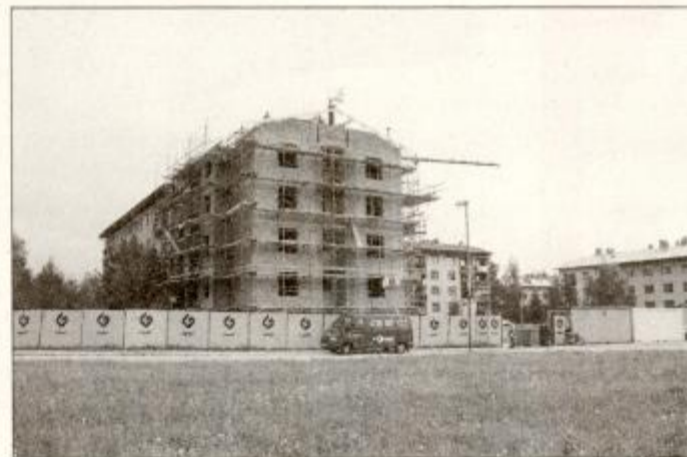
Stanovanjski blok, ki ga GP Granit trenutno gradi v Slovenski Bistrici

bivšo skupno državo. Tako smo z nekaterimi marketinškimi pristopi že prisotni v Bosni, v tuzlanski regiji, saj menimo, da bo takrat, ko bodo odnosi urejeni na meddržavni ravni, to za nas zanimiv trg. Predvsem pa bi radi ohranili to, kar smo v zadnjih treh letih naredili v republiki Latviji,