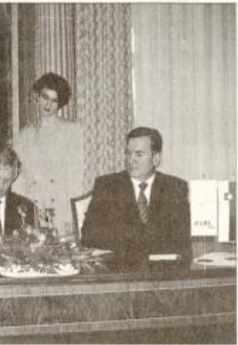
Pogodbo so podpisali predstavniki GIZ Gradis, SCT in DARS.

Ormoška obvoznica bo stala milijardo 119 milijonov tolarjev in se bo gradila v eni fazi z vsemi predvidenimi objekti. Za obvoznico sta bili podpisani dve pogodbi. Traso obvoznice bosta gradila GIZ Gradis kot vodilni