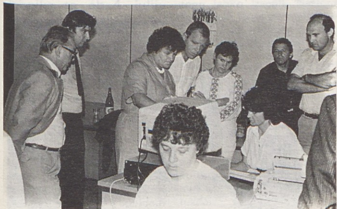
Predstavitve računalniškega fakturiranja v fakturnem oddelku Gorenja Gospodinjiski aparati.

V 23 delovnih dneh junija so delavci proizvodnih tozdov Gorenja Gospodinjiski aparati proizvedli 44.984 štedilnikov , 1.741 manj kot so načrtovali, predvsem zaradi težav pri oskrbi ročajev pečniških vrat iz uvoza, 34.900 pralnih strojev , kar je nekaj več od načrtovanega, 23.072 zamrzovalnih omar , 23.362 zamrzovalnih skrinj in 11.465 hladilnikov . Junija so torej v Gorenju Gospodinjiski aparati izdelali 137.783 velikih gospodinjiskih aparatov , od tega 70.769 za izvoz in 67.014 za domače tržišče.