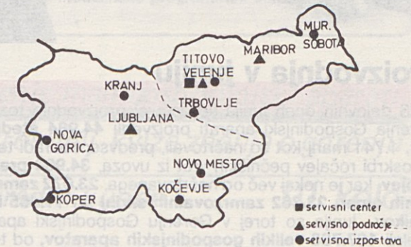
Servisna mreža Gorenja v Sloveniji