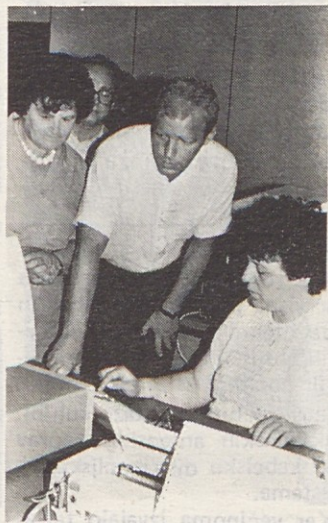
Prvi računi s pomočjo računalnika.