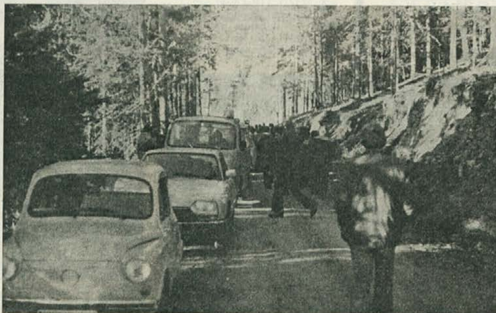
Udeleženci republiškega seminarja o gojenju gozdov v Mislinji