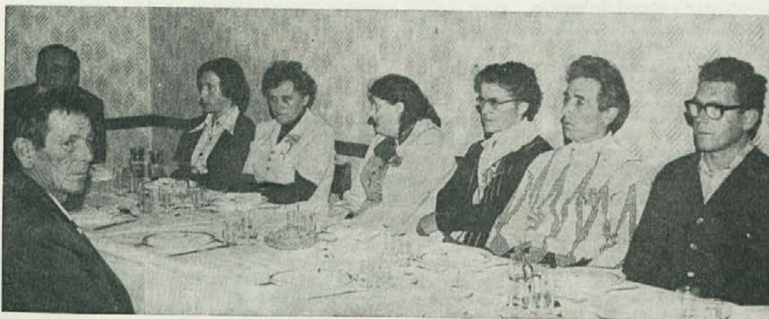
S proslave v Mušeniku