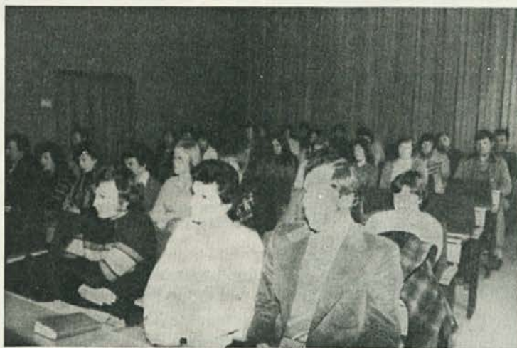
Zelimo si še več takih seminarjev