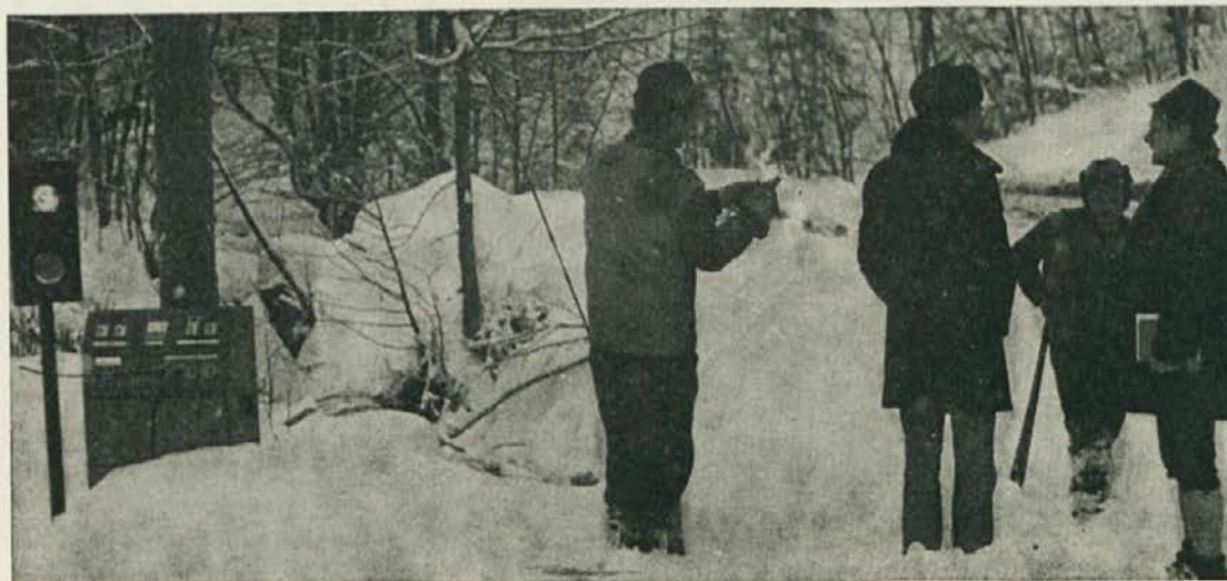
Prvi semafor v Koprivni

Mene pa to nič ne moti! Tebe že ne, kaj pa jaz? Že prejšnji teden sem odložil zimski plašč, z letnimi gumami si pa v takšnem sploh ne morem kaj pomagati.