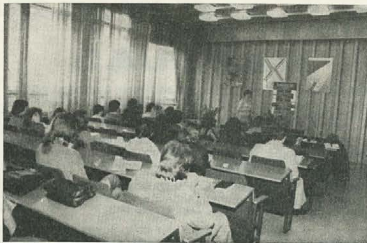
Mladi so z velikim zanimanjem poslušali predavanja

Ena izmed najaktualnejših tem današnjih dni je tudi odnos držav med seboj in širših organizacijskih struktur držav. Ti odnosi se marsikdaj zaostrijo, predvsem pa takrat, kadar grozi obstoječemu stanju preobrat. Imperialistične države poskušajo z vsemi svojimi sredstvi obdržati obstoječo ureditev, zato tudi trošijo ogromna sredstva za oborožitev. Zanimiv je podatek,