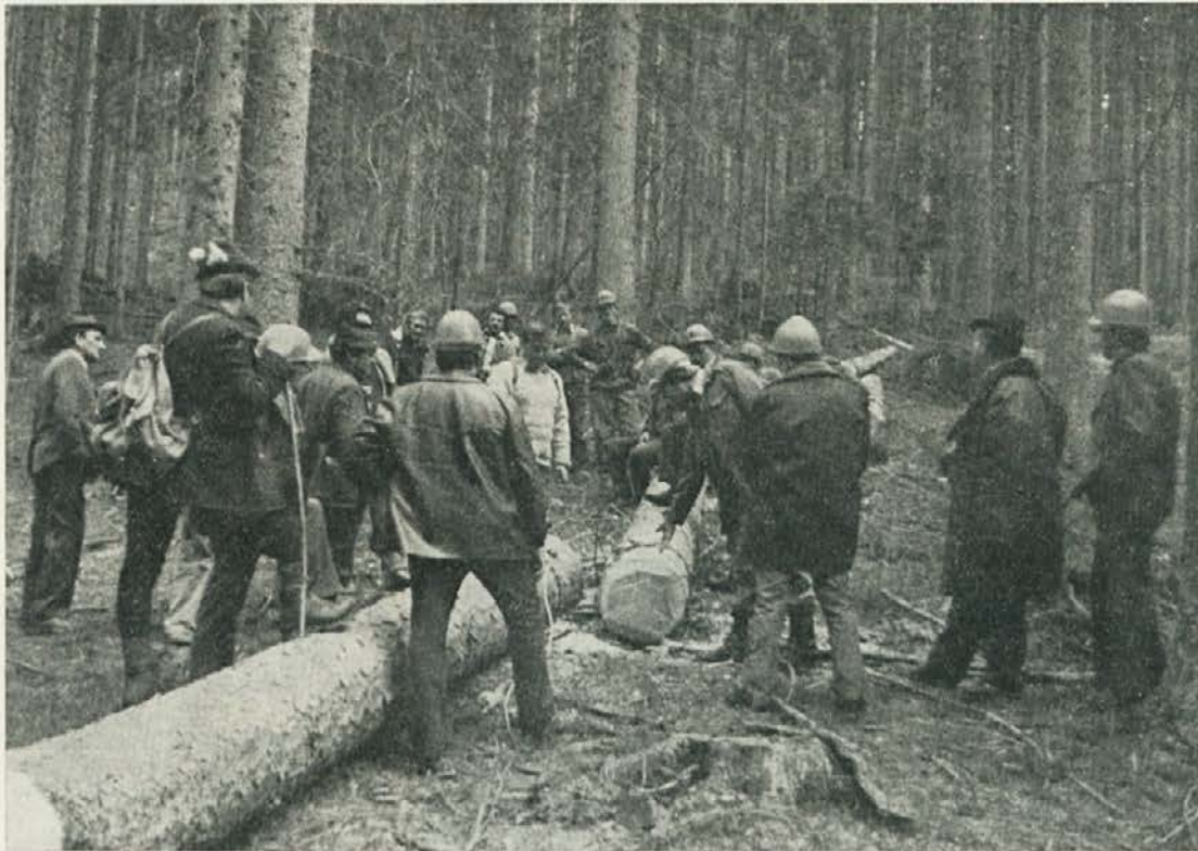
Razprava po izvršenem usmerjenem podiranju drevja na vrhno linijo

— sprejeli so samoupravni sporazum o združevanju dela in sredstev med delovno organizacijo Slo-