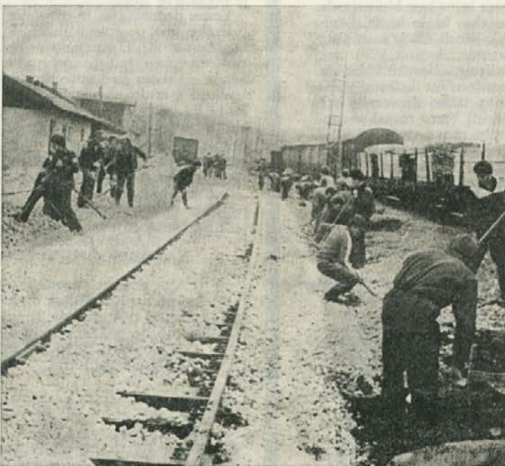
Misel, ki vse preganja in teži — »pred rokom«