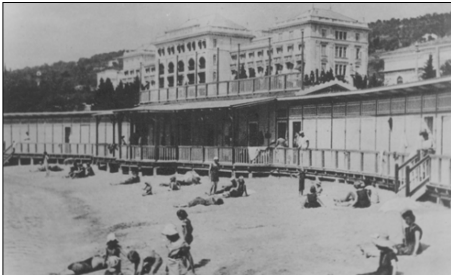
Sl. 1: V letih 1908–1912 zgrajen portoroški hotel Palace je predstavljal najpomembnejši turistični objekt območja (PAK, 26).

Turistična politika cone B se je ob sindikalnem turizmu z letom 1951 iz gospodarskih razlogov začela ponovno obračati k oživitvi donosnejšega inozemskega turizma: "Poudariti moramo, da nudi turizem najlažji vir deviz, saj predstavlja tako rekoč nevidni izvoz in daje nam uvoz. Zato je oportuno posvetiti razvoju turizma primerno pozornost, da bo usposobljen sprejeti čim več tujcev in s tem, bo dal turizem našemu gospodarstvu bogati vir deviz" (PAK, 10). Tem smernicam je bila prilagojena tudi politika investicij, ki so na področju turizma prav v letu 1951 dosegle svojo daleč najvišjo delež v povojnem obdobju z adaptacijo in graditvijo nekaterih pomembnejših hotelskih objektov. Sprejemu tujih gostov je bil v prvi vrsti namenjen hotel Palace v Portorožu, ki je začel obratovati junija 1951, še pred zaključkom vseh obnovitvenih del. Hotel je bil popolnoma prenovljen, na novo so bile opremljene spal-